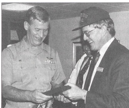
Bundesrat Kaspar Villiger erhält anlässlich seines Besuches an Bord der «USS Independence» vom 8. Februar 1990 in San Diego eine Erinnerungsplakette des Flugzeugträgers vom Kommandanten, Kapitän zur See Thomas Slater. Auch die berühmte Baseball-Mütze ist ein Souvenir von der Besatzung.

Am 10. Januar 1959 war der Träger in Dienst gestellt und der Atlantikflotte zugeeignet worden. Kapitän zur See McElroy war ihr erster Kommandant. Der noch junge Träger hatte zu diesem Zeitpunkt bereits eine bewegte Zeit hinter sich. Im Oktober 1962 war er vor die Küste Kubas zur Unterstützung der Blockade beordert worden. Nach meiner Ankunft spürte man bald einmal, dass das Schiff zudem erst wenige Monate zuvor – am 13. Dezember 1965 – aus einem weiteren Kriegsgebiet nach Norfolk zurückgekehrt war. Als erster Flug-