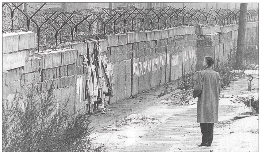
Der Bau der Berliner Mauer im August 1961 führte zu einer der schwersten Krisen zwischen der NATO und dem Warschauer Pakt. Hier beobachtet ein Westberliner 1962 das Schandwerk des Kommunismus.

1982 folgte Spanien als 16. Mitglied in die NATO, am 12. März 1999 schliesslich wurde die Osterweiterung der NATO mit dem Beitritt Polens, der Tschechischen Republik und Ungarns Tatsache. Die Aufnahme weiterer Kandidaten, so etwa von Slowenien, Rumänien, der Slowakei oder Bulgarien ist denkbar, zurzeit aber kaum aktuell. Die NATO blieb nicht von internen Problemen verschont. 1956 etwa standen einzelne NATO-Mitglieder anlässlich der Suez-Krise (Grossbritannien und Frankreich versus USA und UdSSR) nicht auf derselben Seite. Zudem zog sich 1966 Frankreich aus der militärischen Integration der NATO zurück, das Hauptquartier Europa musste 1967 aus Fontainebleau bei Paris nach Belgien verlegt werden, wo es sich heute noch befindet. Glücklicherweise hinterliessen aber diese kritischen Phasen keine nachhaltigen oder gar die Existenz bedrohenden Spuren. ☒