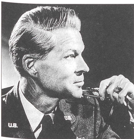
Der Luftwaffengeneral Lauris Norstad war 1956 Oberbefehlshaber der Alliierten Streitkräfte in Europa (SACEUR). Bis zum heutigen Tag waren alle SACEURS seit 1949 Amerikaner, der erste von ihnen General Dwight Eisenhower.

atlantische Sicherheitsgarantien. Dänemark, Island, Italien, Norwegen und Portugal wurden am 15. März 1949 eingeladen, an diesen Verhandlungen teilzunehmen. Die Gespräche gipfelten schliesslich in der Unterzeichnung des Nordatlantischen Verteidigungspaktes (NATO – North Atlantic Treaty Organisation) am 4. April 1949 in Washington, D.C., eines Vertrages, der auf dem Artikel 51 der Charta der Vereinigten Nationen fusst. Dieses hält das Recht ihrer Mitglieder fest, sich bei einem Angriff allein oder kollektiv zu verteidigen. Am 9. Mai hob die Sowjetunion die Berlin-Blockade auf. Drei Jahre später, am 18. Februar 1952, traten Griechenland und die Türkei der NATO bei, nicht zuletzt wiederum wegen bedrohlichen sowjetischen Avancen gegenüber diesen beiden Staa-