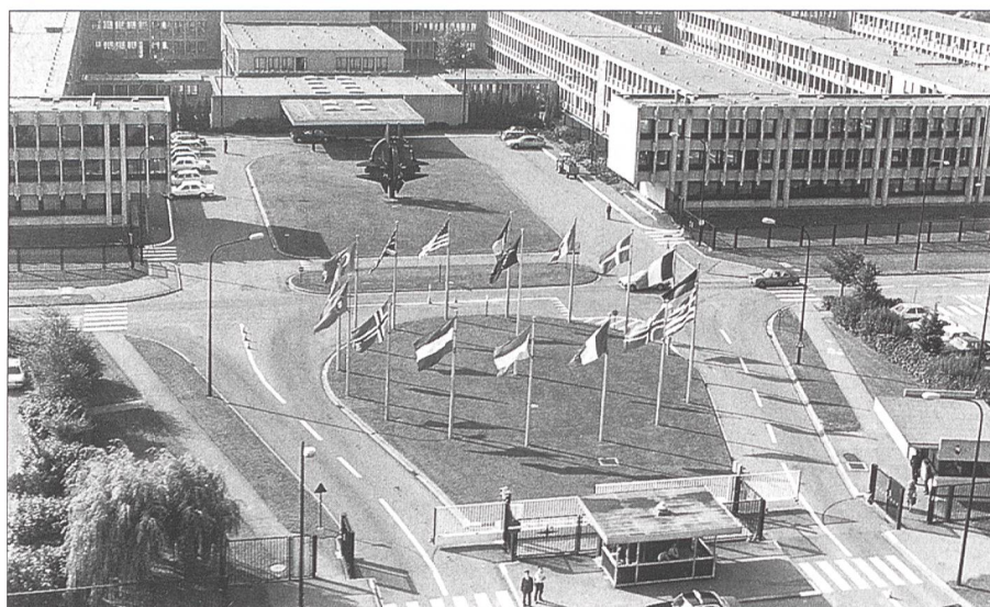
Der Haupteingang zum Hauptquartier der NATO in Brüssel, die Aufnahme stammt von 1984. Hier ist heute auch der Hauptsitz des NATO-Generalsekretärs Solana.

1948 von Belgien, Frankreich, Luxemburg, den Niederlanden und Grossbritannien der Brüsseler Vertrag unterzeichnet. Dieses primär politische Signal bezweckte eine gemeinsame Verteidigung, um der zunehmenden ideologischen, politischen und militärischen Bedrohung durch die Sowjets zu widerstehen. Auf diesen Vertrag folgten Gespräche mit den USA und Kanada über eine Ausweitung und gegenseitige trans-