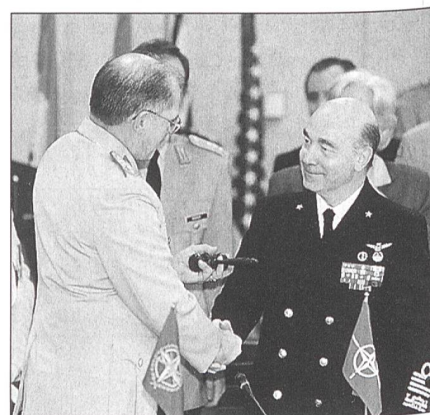
Am 6. Mai 1999 hat der italienische Admiral und Marineflieger Guido Venturoni den deutschen General Klaus Naumann (links) als Vorsitzenden des Militärausschusses der NATO offiziell abgelöst.

Als Folge der zunehmenden Spannungen zwischen Ost und West wurde am 17. März