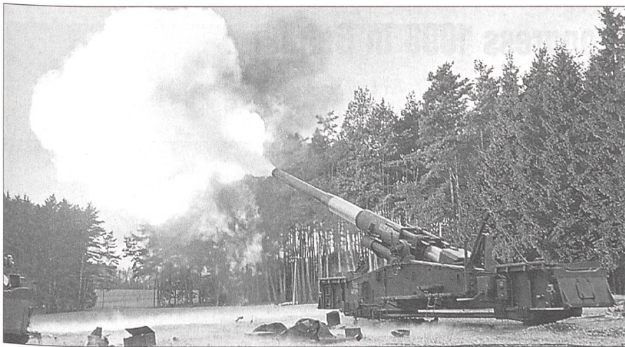
In den 50er und 60er Jahren basierte die NATO im Rahmen ihrer Strategie der «Massiven Vergeltung» zu wesentlichen Teilen auf der Überlegenheit ihrer Nuklearwaffen, deren Gebrauch sie angesichts der relativ schwachen konventionellen Kräfte in einem frühen Stadium eines Konfliktes erwägte. Zu den taktischen Nuklearwaffen gehörten auch diese amerikanischen Riesengeschütze mit einem Kaliber von 280 mm. Die Aufnahme zeigt ein solches Geschütz des 265. Feldartillerie-Bataillons im Jahre 1958 beim Abfeuern einer Granate auf dem Truppenübungsplatz von Grafenwöhr in Deutschland.