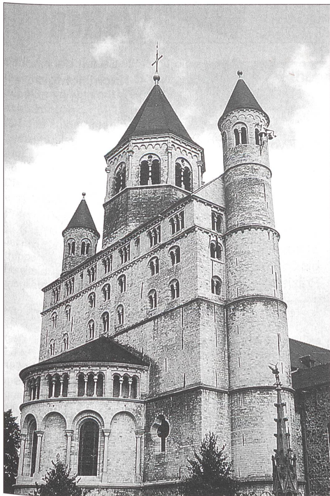
Die Stiftskirche St. Gertrud in Nivelles.