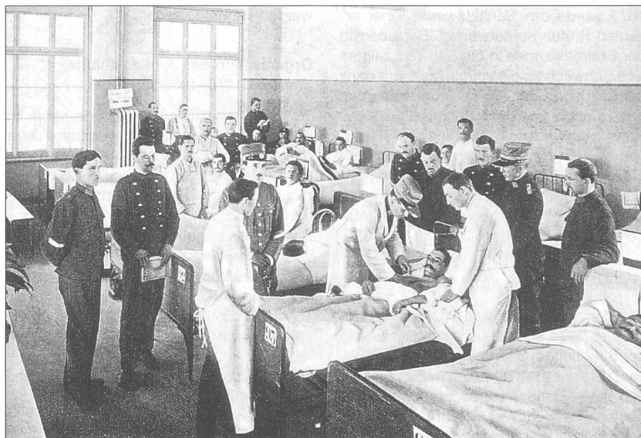
Das waren noch Zeiten ...

1798 wurde das Kriegskommissariat mit der obersten Leitung und Verwaltung des gesamten Kriegsmedizinwesens betraut. In der Folge erhielt jedes Bataillon einen Bataillionschirurgen im Hauptmannsrank und zwei Unterchirurgen im Unterleutnantsrang. Sanitätspersonal und Sanitätsformationen blieben aber streng kantonal geordnet. In jedem Kanton stand ein