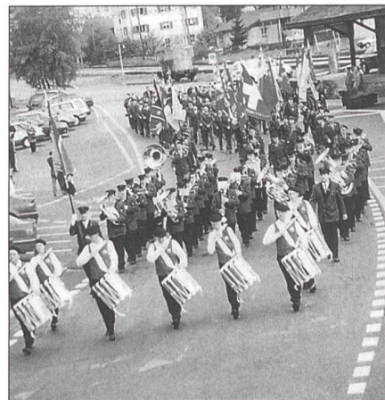
Umzug mit Fahnen und Spiel durch Schüpfheim.

Regierungsrat Dr Ulrich Fässler hiess die Delegierten willkommen im militärfreundlichen Kanton Luzern und speziell in der «freien Republik