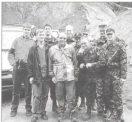
Trotz misslichen Wetterverhältnissen ist die Stimmung in dieser Gruppe gut.

Im Mündungsgebiet der Lorze nahe Obfelden hatte der UOV Emmenbrücke einen Patrouillenlauf mit vier Posten organisiert. Bevor gestartet werden konnte, musste ein anspruchsvoller Theorietest gelöst werden. Wie zum Trost für die Organisatoren und Wettkämpfer hörte der Regen für die Dauer des nun folgenden Wettkampfes auf, so dass die Teilnehmer die Posten trockenen Fusses erreichen konnten. Der eigentliche Wettkampf bestand aus einem Handgranaten-Werfen, einer Kartenaufgabe und einem abwechslungsreichen Luftgewehr-Schiessen. Eine Panzererkennungsaufgabe rundete schliesslich das abwechslungsreiche Programm ab.