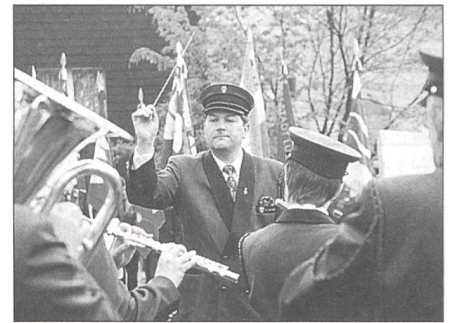
Platzkonzert vor dem Pfarreiheim Schüpfheim.

Entlebuch». In einer Zeit, in der von «ewigem Frieden» keine Rede sein könne, brauche es weiterhin eine starke Landesverteidigung. Deren wichtigstes Element sei nach wie vor die Armee – und zwar eine in der Bevölkerung verankerte Milizarmee. Der SUOV hat in diesem Bereich eine wichtige Aufgabe. Die Armee XXI werde «die Armee der Unteroffiziere» sein.