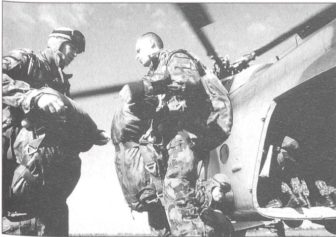
Gegenseitige Kontrolle der Ausrüstung vor dem Einsteigen in den Absetzhubschrauber Mi-8 Hip.

scharfen Schuss auszuprobieren. Nach einer kurzen Demonstration der Waffen, bei der die 17er alle Waffen zerlegten und wieder zusammensetzten, fuhren wir zu einer Schiessanlage innerhalb der Luftwaffenbasis. Jeder konnte 20 Schüsse abfeuern. Dies ist sehr viel, wenn man bedenkt, dass heute für die ganze Grundausbildung in der ungarischen Armee lediglich 9 Schuss pro Mann zur Verfügung stehen! Das Wettschiessen wurde nach einem Stechen zwischen zwei Schweizern und zwei Ungarn von unseren Gastgebern gewonnen.