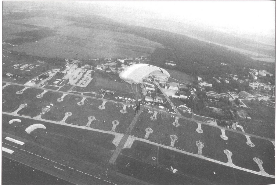
Schweizer Paras über Ungarn. Eine Follow-the-Leader-Formation der Fsch Aufkl Kp 17 über dem ungarischen Hubschrauber Stützpunkt von Veszprém.

zeigte alle ihre Flugzeuge (MiG-21 Fishbed, Mig-29 Fulcrum, An-24 Colt), die bekannten Hubschrauber (Mi2 ??, Mi8 Hip und Mi24 Hind). Aber auch schweres Material gab es zu entdecken: Kampfpanzer T-64 und T-72 sowie diverse Kanonen und Geschütze. Die Piloten zeigten den Besuchern eine kleine Kostprobe ihres Könnens. Kampf- und Transporthubschrauber führten Staffelflüge vor und vermittelten einen kleinen Einblick in einen Ablauf eines Sturmangriffes. Im Verlaufe der Air-Show nutzten wir die Gelegenheit, uns beim Kommandanten der ungarischen Luftwaffe, der mit einer MiG-21 eingeflogen war, mit einem Delegationsgeschenk persönlich zu bedanken. Am Nachmittag sprangen die Fsch Aufkl zusammen mit ihren ungarischen Kollegen anlässlich der Air-Show ab und demonstrierten vor Tausenden von Zuschauern ihr Können.