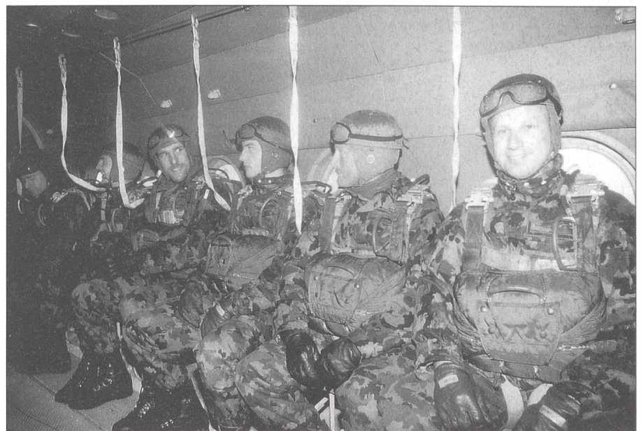
Vor dem Automatenabsprung aus der Mi-8. Die Reissleinen sind bereits eingehakt.

Auf Wunsch von Hptm Sievert erhielten wir auch die Gelegenheit, verschiedene ungarische Pistolen und Sturmgewehre im