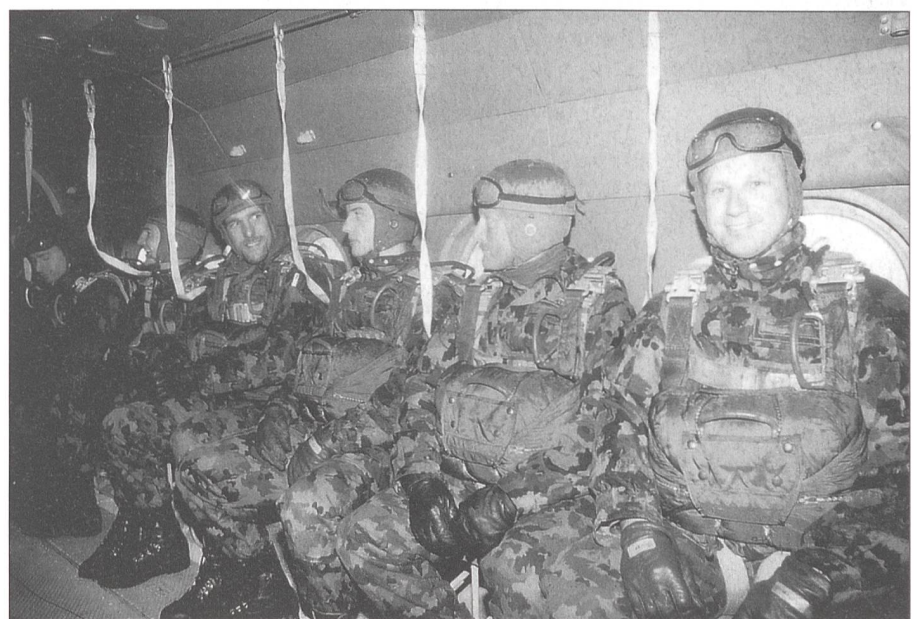
Vor dem Automatenabsprung aus der Mi-8. Die Reissleinen sind bereits eingehakt.