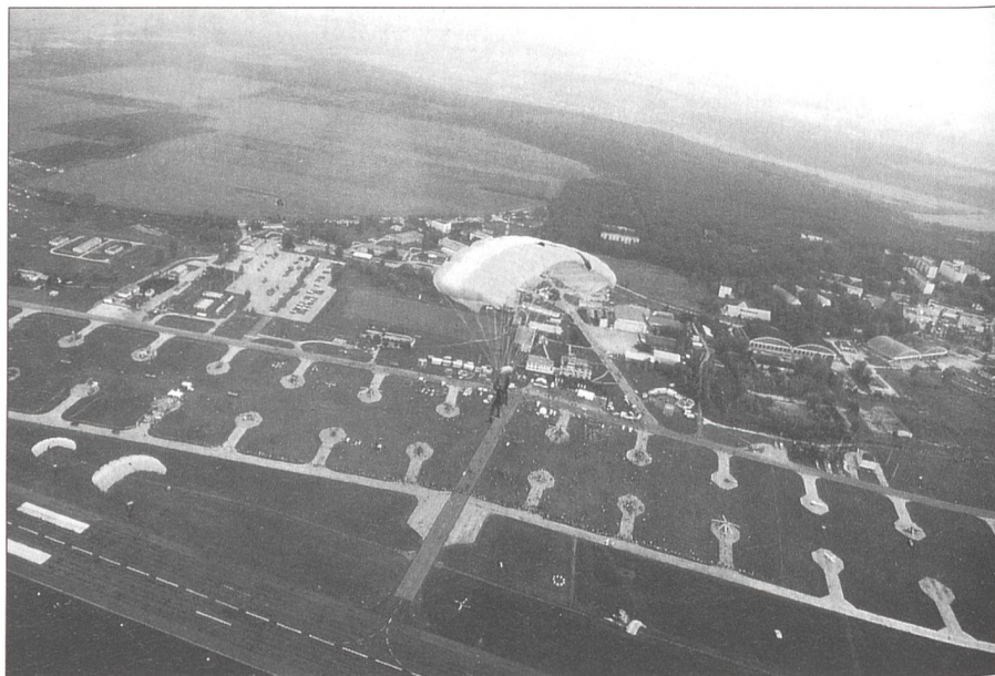
Schweizer Paras über Ungarn. Eine Follow-the-Leader-Formation der Fsch Aufkl Kp 17 über dem ungarischen Hubschrauber Stützpunkt von Veszprém.

immer wieder gefragt. Das Spektrum des Dolmetschereinsatzes war dementsprechend sehr breit. Es umfasste sowohl den militärischen als auch etliche Aspekte aus dem alltäglichen privaten Bereich. Ein weiteres Erschwernis war, dass zwei völlig unterschiedliche Führungs- und Organisationskulturen sowie Denkweisen aufeinander prallten. Dies hatte zur Folge, dass jeweils die verschiedenen Vorstellungen und Erwartungen beider Parteien berücksichtigt werden mussten. Der praktische Erfahrungswert meines Einsatzes als Sprachspezialist mit Dolmetscheraufgabe war vor diesem Hintergrund sehr gross. Ich konnte meinen Wortschatz mit neuen Fachausdrücken, speziell im Zusammenhang mit Organisation oder Material, ausbauen. Die gesammelten praktischen Erfahrungen könnten in einem neuen SSp Sprachkurs für Ungarisch oder auch bei Befragungsübungen durchaus eingesetzt werden. Auch vom psychologischen Aspekt her war dieser Einsatz interessant. Mit der Zeit konnte ich die Erfahrung machen, dass ich nicht nur zu «übersetzen», sondern auch zu «vermitteln» hatte. Aufgrund der unterschiedlichen Führungs- und Organisationssysteme wurde der Übersetzungsfluss nämlich recht behindert. Es lag also stark beim Übersetzer selber, die Gespräche im Sinne einer besseren Effizienz zu beeinflussen und zu steuern. Auch mussten die verschiedenen Vorstellungen der involvierten Personen in Einklang gebracht werden. Auch hier war eine geschickte Gesprächsführung seitens des Ssp sehr gefragt.