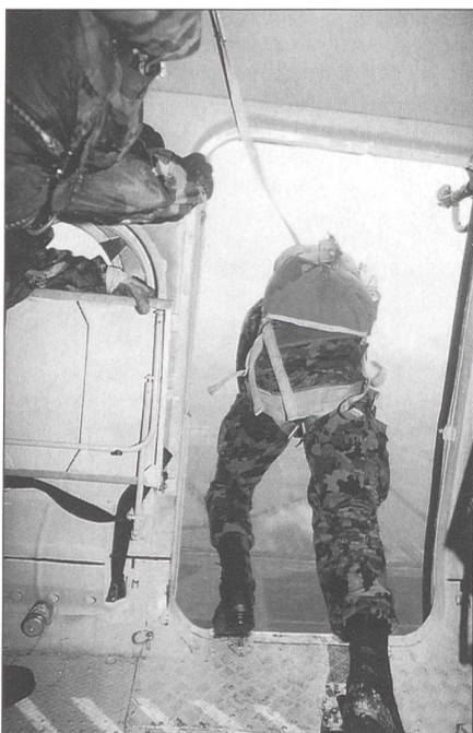
Dynamischer Abgang eines 17ers aus der linken Seitentüre der Mi-8.