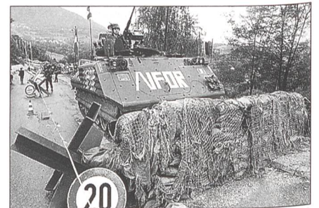
Diese Aufnahme zeigt einen modifizierten M-113-Schützenpanzer des italienischen Heeres an einem serbisch-bosnischen Kontrollpunkt in der Nähe von Sarajevo im August 1996. Das Fahrzeug gehört zur IFOR («Implementation Force») der NATO, welche das Abkommen von Dayton durchsetzt. Solche Missionen gehören zum neuen Aufgabenspektrum der NATO nach der Wende von 1989.

Die gewaltige Auseinandersetzung der beiden von den Supermächten angeführten Paktsysteme spitzte sich anlässlich der Aufrüstung der UdSSR mit den SS-20-Mit-