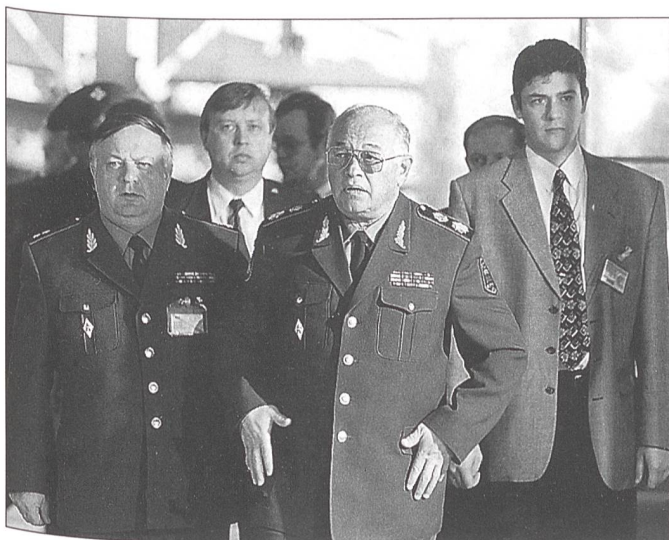
Diese Aufnahme zeigt den russischen Verteidigungsminister Marschall Sergejev (Mitte) bei der Ankunft im Hauptquartier der NATO anlässlich des Verteidigungsminister-Treffens vom 12. Juli 1998. Er wird begleitet von Generalleutnant Savarzin (links), dem höchsten Militärvertreter Russlands bei der NATO. Die Russen haben sich nach Ausbruch des Kosovo-Krieges aus Protest von allen Aktivitäten bei und mit der NATO zurückgezogen.

1991 ermöglichte diese im Rahmen des «Nordatlantischen Kooperationsrates – NACC», 1994 mit dem Programm «Partnerschaft für den Frieden – PfP» (welchem am 11. Dezember 1996 auch die Schweiz beigetreten ist) und am Madrider-Gipfel im Juli 1997 mit dem «Euro-Atlantischen Partnerschaftsrat – EAPC» (Schweiz ebenfalls Mitglied) neue Plattformen für eine transatlantische sicherheitspolitische Zusammenarbeit mit interessierten Staaten, vor allem auch aus dem ehemaligen Ostblock. So sind Instrumente zum gemeinsamen Krisenmanagement von NATO- und Nicht-NATO-Staaten, selbst mit russischer Beteiligung, entstanden. Beim Einsatz der IFOR und der SFOR («Implementation bzw. Stabilisation Force») im ehemaligen Jugoslawien sind diesbezügliche erste Erfahrungen gemacht worden. Auch bei der KFOR («Kosovo Force») zeichnet sich diesbezüglich ein solches Zusammengehen ab.