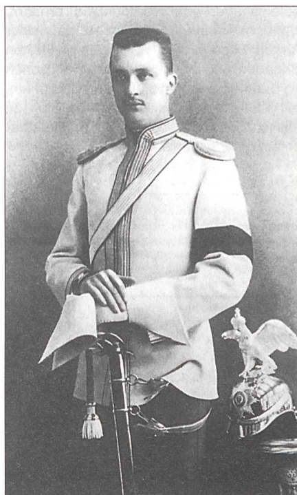
Mannerheim als Chevalier-Gardeleutnant im Dienste des Zaren.

Nach der Grundausbildung im finnischen Kadettenkorps und dem Abitur absolvierte Mannerheim die Nikolai-Kavallerieschule in St. Petersburg. Nach zweijährigem Dienst bei den Schwarzen Dragonern in Kalisz in Westpolen gelang ihm der Eintritt