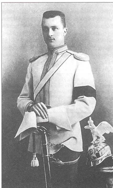
Mannerheim als Chevalier-Gardeleutnant im Dienste des Zaren.

Nach der Grundausbildung im finnischen Kadettenkorps und dem Abitur absolvierte Mannerheim die Nikolai-Kavallerieschule in St. Petersburg. Nach zweijährigem Dienst bei den Schwarzen Dragonern in Kalisz in Westpolen gelang ihm der Eintritt