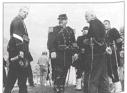
In der Ehrenkompanie des SUOV und des SAM stehen Vertreter der beiden jungen Generationen neben Aktivdienstveteranen.

Beteiligt an der Organisation des «Rütlifeuer 99» waren folgende Organisationen: Aktion Aktivdienst (AA), Arbeitskreis gelebte Geschichte (AGG), Gesellschaft für freiheitliches Waffenrecht (Pro Tell), Schweizerische Offiziersgesellschaft (SOG), Schweizerischer Unteroffiziersverband (SUOV), Veteranenvereinigung des SUOV, Schweizerischer Feldweibelverband (SFwV), Schweizerischer Fourierverband (SFV), Schweizerische Gesellschaft für Historische Waffen- und Rüstungskunde (SGHWR), Schweizerische Gesellschaft für militärhistorische Studienreisen (GMS), Schweizerische Vereinigung für Freiheit, Demokratie und Menschenwürde «Pro Libertate», Stiftung «Pro Tell», Verein Schweizer Armeemuseum (VSAM), Verband Schweizerischer Schützenveteranen, Zeitschrift «Schweizer Soldat». PC-Konto für Spenden: 30-757003-2/Rütlifeuer 99