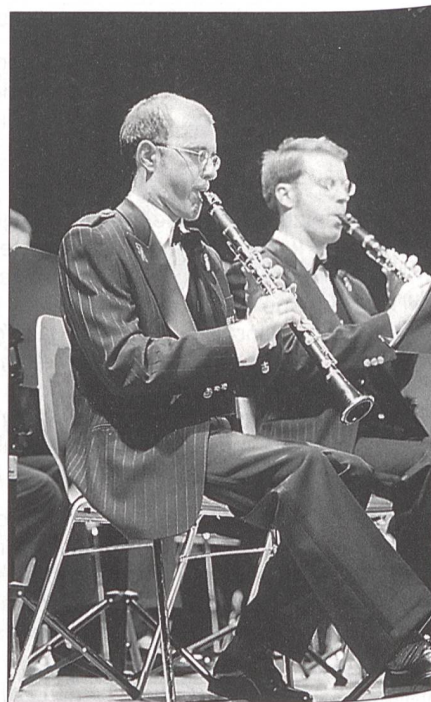
Symphonisches Blasorchester Schweizer Armeespiel: Für Auftritte in Konzerthäusern trägt dieses Orchester schwarze Galauniformen.

Seit diesem Jahr wird die musikalische Qualität auch optisch durch die neuen