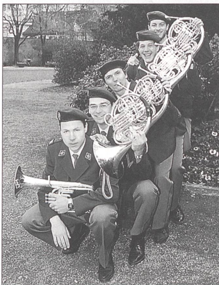
Die Waldhörner präsentieren sich.

Trompeter und Tambouren erfüllen in unserer Armee eine ausserordentlich wichtige Aufgabe. Ohne Zweifel gilt es, mit dem Spiel den Kontakt zur Bevölkerung zukünftig noch gezielter zu nutzen. Die Spiele sollten meines Erachtens auch der kontinuierlichen Ausbildung wegen jährlich Dienst leisten. Im für die Truppe WK-freien Jahr könnte das Spiel auf der Infrastruktur einer