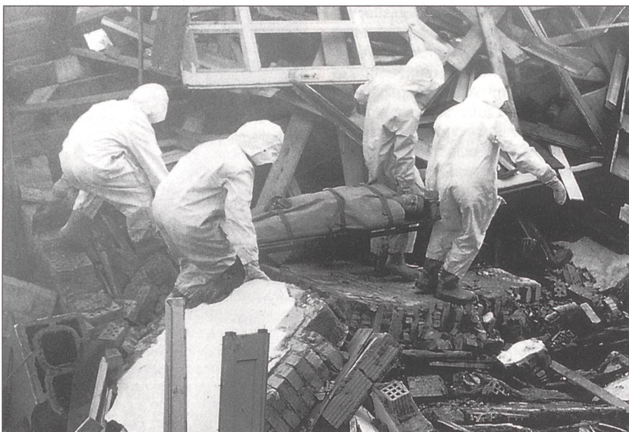
Rettungstruppen während der Ausbildung (Bergungseinsatz)

Den Medien war zu entnehmen, dass eine vorgezogene Teilrevision des Militärgesetzes geprüft wird, um so die Möglichkeit zu schaffen, bewaffnete Einheiten ins Ausland