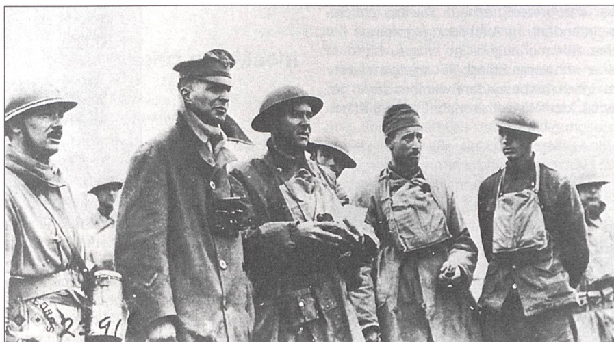
MacArthur als Brigadegeneral im Ersten Weltkrieg.

Angesichts der aussichtslosen Lage der Verteidiger wurde MacArthur am 23. Februar 1942 abberufen und zum Oberbefehlshaber der US-Streitkräfte im SW-Pazifik mit Standort Australien ernannt. Unermüdlich für eine Konzentration der Kräfte gegen Japan kämpfend, gelang es ihm – unter geschickter Ausnutzung der Marine und der Luftwaffe –, seine Gegenoffensive über Neu-Guinea, die Admiralitätsinseln, die Salomonen voranzutreiben und sein Versprechen, die Philippinen den Japanern wieder abzunehmen, wahrzumachen. Am 23. Februar 1945 konnte er Manila befreien und – nach seiner Beförderung am 6. April 1945 zum Oberbefehls-