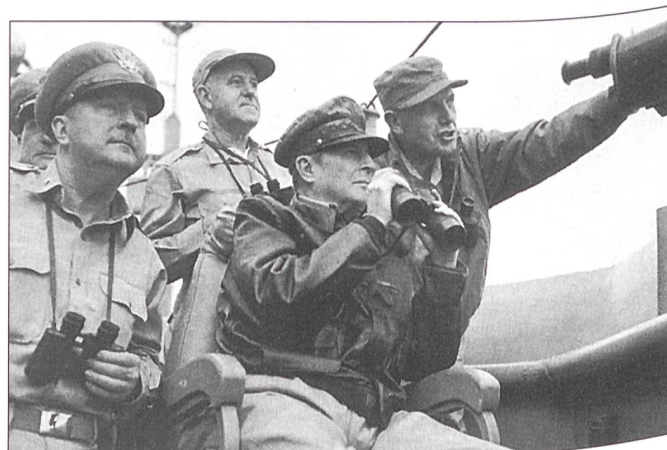
MacArthur überwacht das amphibische Landemanöver im Rücken des Feindes in Korea.