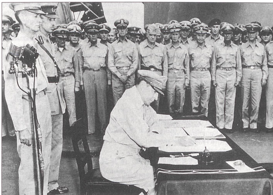
MacArthur unterzeichnet die Kapitulation Japans auf «MSS Missouri» am 2. September 1945.

Japan versuchte ab November 1944 zweifelt, die erfolgreiche Serie amphibischer Grossoperationen der Amerikaner durch den Einsatz von «Kamikaze-Fliegern», die sich mit ihren vollbeladenen Jagdbombern auf die amerikanische Flotte stürzten, zu stoppen. Vergeblich. Im Juni 1945 waren die Philippinen befreit, Okinawa erobert. Am 6. August 1945 wurde die Atombombe über Hiroshima und drei Tage später über Nagasaki ausgeklinkt, und am 2. September 1945 empfing MacArthur als Oberbefehlshaber der gesamten pazifischen Streitkräfte auf dem Schlachtschiff Missouri die Delegation der japanischen