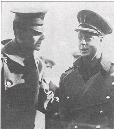
MacArthur als Kommandant von West Point im Gespräch mit dem Prinz of Wales 1919.

Als General mit Kriegserfahrung war es ihm ein grosses Anliegen, in West Point mit überholten Bräuchen und verstaubten Vorstellungen aufzuräumen. Der Lehrkörper war darob wenig erbaut. Da ihm als Superintendent im Ausbildungsgremium nur eine Stimme zugebilligt wurde, hatte er einen schweren Stand, Neuerungen durchzusetzen. Insbesondere war ihm daran gelegen, den Wissenshorizont der künftigen