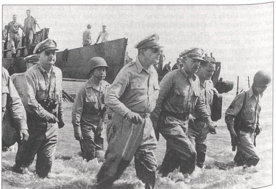
MacArthur kehrt auf die Philippinen zurück.

MacArthur verfolgt mit grösster Besorgnis den Aufbau Japans zur pazifischen Weltmacht und drittgrössten Seemacht der Welt. Japan versucht systematisch, die sogenannte «asiatische Wohlstandssphäre», bestehend aus dem seit 1918 besetzten Korea, der 1932 eroberten Mandschurei und der von dort aus schrittweise überrollten östlichen Mongolei sowie des ost- und südchinesischen Küstenraumes zu einem wirtschaftlich und politisch autonomen Grossreich zu formen. Dass die Philippinen, Thailand und Indochina, Malaysia, Sumatra, Borneo, Celebes, Neuguinea sowie die Marianen-, Karolinen-, Marschall-, Salomon-Inseln und das Bismarck-Archipel als wichtige Versorgungs-