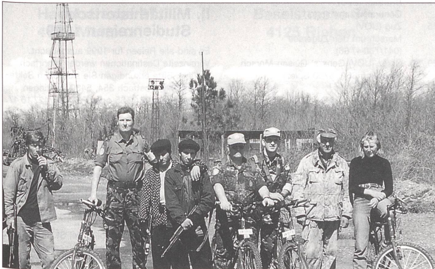
Partisanengruppen sind überall. Eine heikle Aufgabe für die UN-Beobachter.

gelt werden konnte. Auf nationaler Ebene waren die Fronten verhärtet, und bei jedem Vermittlungsversuch schnellte das Risiko wegen möglichen Attentaten wieder in die Höhe.