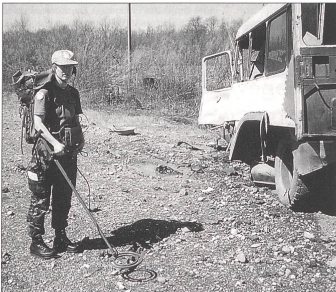
Das Minensuchgerät gehört zur Ausrüstung. Die Minen sind allgegenwärtig.

Sicherheit. Erstere wird durch die äusseren Umstände gegeben, wird auf der Ebene der Aussenminister und der Diplomatie ausgehandelt. Eine Mitarbeit in einer internationalen, friedensunterstützenden Mission, vor allem wenn sie nicht schon seit Jahrzehnten besteht, ist in den seltensten Momenten ein Ferientrip. Es braucht enorm viel Geduld, um die ehemals kriegsführenden Parteien an den gleichen Tisch zu bringen. In Georgien kamen die Erfolgserlebnisse am Anfang auf der regionalen Ebene zustande. So fand jeweils jeden Mittwoch ein Meeting statt, bei dem wenigstens der kleine Grenzverkehr gere-