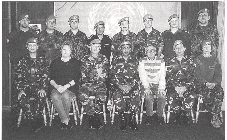
Aus aller Herren Ländern sind Teilnehmer nach Bière gekommen, um den UN-Kurs zu bestreiten

Der Schwerpunkt der Ausbildung liegt in der ersten Woche auf der trockenen Theorie, anschliessend folgt die praktische Arbeit am Funk, auf Patrouille, die Technik