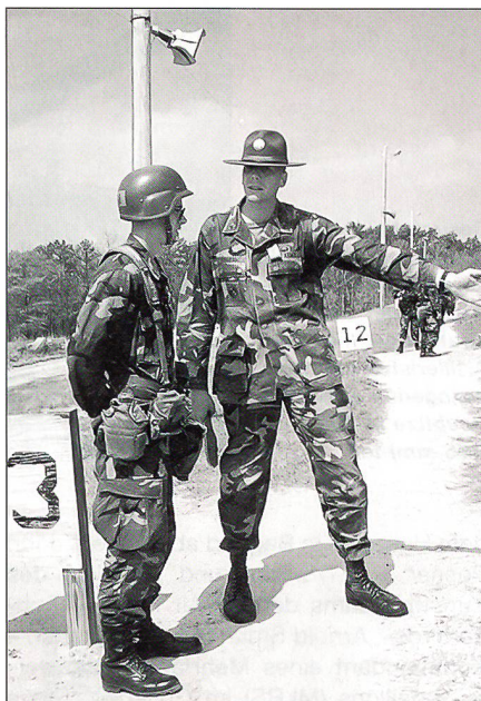
Rangerausbildung in Fort Benning, Georgia. Der Instruktor (rechts) trägt den typischen «Pfadfinder»-Hut. Die Rangerausbildung ist eine besonders harte Schulung und dürfte etwa jener unserer Grenadiere entsprechen. Zur Ausbildung gehört auch das Fallschirmspringen.