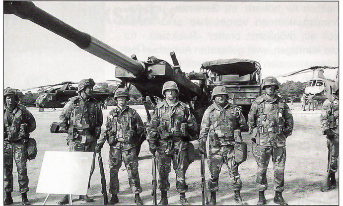
Besuch beim US Marinecorps in Camp Lejeune, North Carolina. An der Demonstration nahmen auch Artilleristen mit der gezogenen schweren Haubitze M-198 (155 mm) teil.