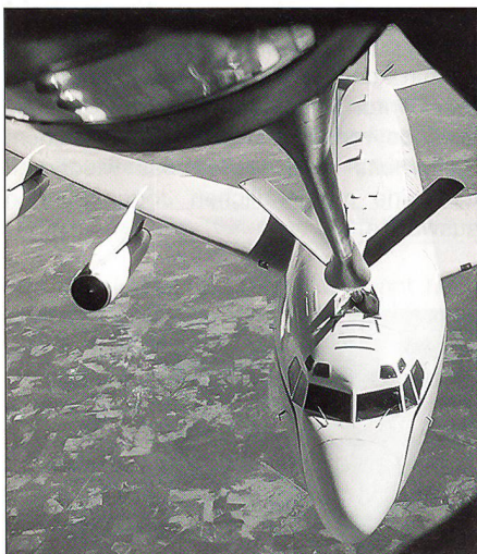
Auf einem Fieldtrip von Andrews Air Force Base nach New Orleans flogen wir an Bord eines Tankers KC-135R der US Air Force mit. Dabei konnten wir aus der Kanzel des «Boom-Operators» aus nächster Nähe ein Betankungsmanöver mit einer EC-135H verfolgen.