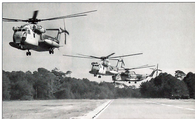
Die Marines demonstrieren ihre eigenen Luftstreitkräfte anlässlich einer Waffendemonstration auf einer Aussenstelle des Ausbildungszentrums von Camp Lejeune, North Carolina. Hier sind es drei schwere Transporthelikopter des Typs Sea Stallion CH-53.

Über das ganze Jahr verteilt hat der Student insgesamt 7 schriftliche Seminararbeiten, so genannte Papers, zu verfassen. Hinzu kommen mündliche Präsentationen sowie zwei mündliche, einstündige Prüfungen. Jede Arbeit, jede Prüfung wird von mindestens zwei Professoren bewertet bzw. abgenommen. Wie in den USA üblich, kommt auch dem Sport ein grosser Stellenwert zu. Er ist mit viel Prestige vor allem im Wettkampf gegen andere Militärschulen und Universitäten verbunden. Wir Europäer haben uns hier auf unseren Fussball, auf das Joggen, Golf oder Tennis konzentriert, einzelne versuchten sich in Softball, nur wenige wagten sich ans Boxen oder an den American Football. Immerhin konnten wir uns vom Präsidenten Bill Clinton inspirieren lassen, der das Gelände von Ft McNair mit samt seinem Sicherheits- und Preetross wiederholt für seine morgendlichen Joggingrunden auswählte.