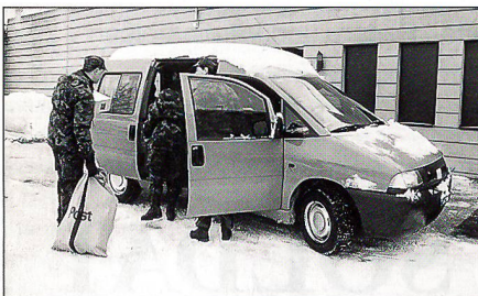
Post zustellen: Bei jeder Witterung ...

wenigen bekannt. Aber gewiss ist, dass viele Helfer im Hintergrund für eine schnelle Postabfertigung besorgt sind. Ihnen allen ist dieser Artikel als ein kräftiges Dankeschön der Wehrmänner gewidmet.