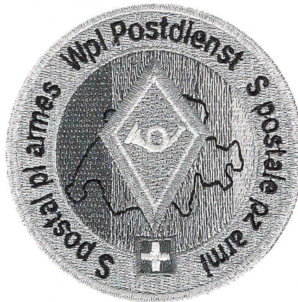
Oberarmbadge des Waffenplatz-Postdienstes.

Im Ausbildungsdienst erfolgt die Postversorgung einmal täglich. Der Bürger in Uniform kann folgende Sendungen, die seine