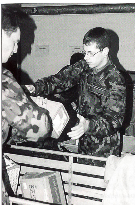
Einander in die Hände arbeiten.