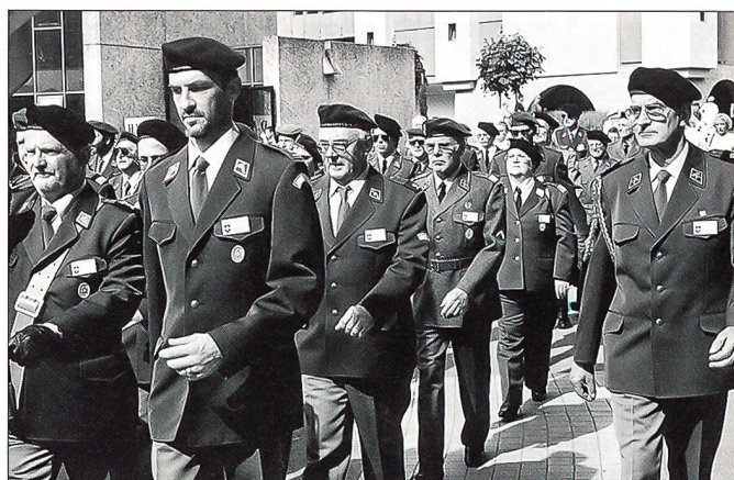
Geschlossener Aufmarsch der Schweizer Delegation an einer internationalen Veranstaltung.

ganisiert. Wenn Sie liebe Leserin, lieber Leser, diesen Bericht aufmerksam studiert haben, könnte das Gefühl aufkommen, diese Wallfahrt bestehe nur aus Gottesdienstbesuchen. Es ist schon so, dass die Gottesdienste einen besonderen Stellenwert haben, da es im Grundsatz ein religiöser Anlass ist. Dass aber die kameradschaftlichen Kontakte nicht zu kurz kommen, darf doch auch erwähnt werden. All die Offiziere, Unteroffiziere und Soldaten in ihren zum Teil farbenfrohen Uniformen, freuen sich auf Kontakte zu Armeen anderer Länder. Viele Freundschaften unter Kameraden und Kameradinnen aus verschiedenen Nationen sind schon entstanden. Besonders diejenigen, welche im Zeltlager logieren, haben sehr gute Möglichkeiten, mit anderen Militärpersonen bleibende Beziehungen aufzubauen. Dazu trägt natür-