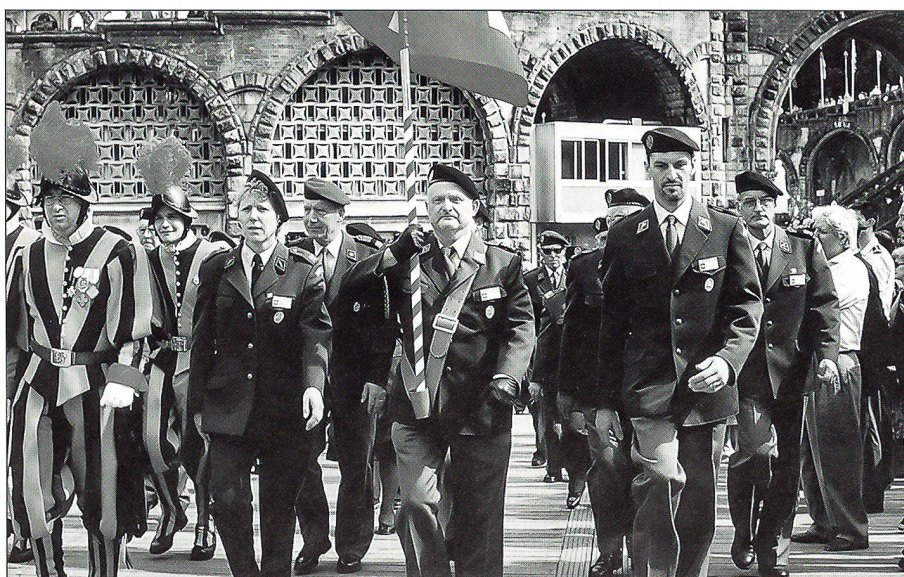
Schweizer Bürger in verschiedenen Uniformen, Teilnehmer Päpstliche Schweizergarde und Schweizer Armeeangehörige miteinander zu einem Anlass.

Als rein militärischer Anlass darf die Totenehrung der französischen Armee beim Soldatendenkmal in der Innenstadt bezeichnet werden. Jedes Land stellt zu diesem Anlass eine grössere Delegation mit der entsprechenden Landesfahne. Mit einem Marsch durch die Stadt wurde die Feier eingeleitet. Pünktlich um 18 Uhr erfolgte die Kranzniederlegung. Im Anschluss daran wurden die Delegationen durch die anwesenden Generäle und den französischen Militärbischof einzeln begrüsst. Mit dem geschlossenen Rückmarsch durch die Stadt fand diese Feier ihren Abschluss. Am Abend des zweiten Tages nahmen wir