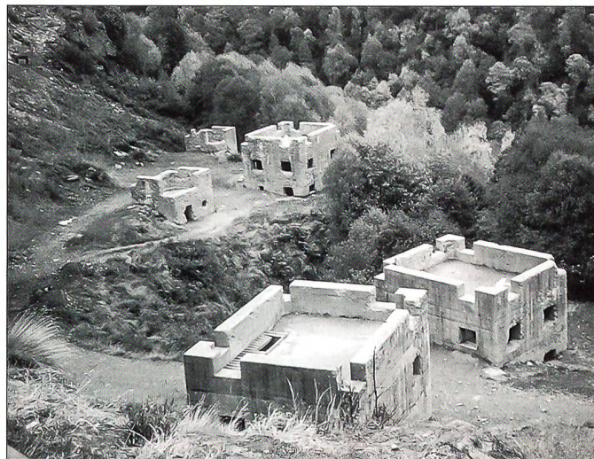
Traurige Bilder in Isonne: Nicht ausgelastete Ortskampfanlage.

Immerhin wurde erreicht, dass sich die Kp während drei Wochen (KVK sowie WK-Wochen 1 und 2) in Felsberg bei Chur einquartieren und den Waffenplatz von Chur benützen durfte. Während dreier Tage stand zudem die Ortskampfanlage St. Luzisteig zur Verfügung. Dies erwies sich – weitab vom