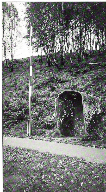
Waffenplatz Isonne: Schiessplätze nicht belegt.

Verschiedene Standortgemeinden und Zulieferbetriebe (Bäckereien, Metzgereien usw.) leiden unter der infolge der Armee-reform gesunkenen Anzahl der Dienstage. So gibt es Gemeinden, die vor 1995 ihre Infrastrukturanlagen ausgebaut haben und auf Einnahmen von WK-Truppen angewiesen sind. Die Truppen sind deshalb an vielen Orten hochwillkommen. Dies erleichtert die Organisation eines WK erheblich. Aus