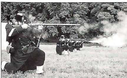
«NGST» anno 1861...

In den Statuten wird neben der Traditionspflege auch die Erhaltung historischer Ausrüstungsgegenstände, Waffen und Uniformen als Aufgabe genannt. Die eigene Dokumentationsstelle sammelt historische Bilder, Fotos, Reglemente, Memoiren, die Aufschluss über den Soldatenalltag unserer Vorfahren geben können. Der Rüstmeister ist für die historisch getreue Equipierung der uniformierten Mitglieder verantwortlich. Der Drüllmeister besorgt die Ausbildung der Mann-