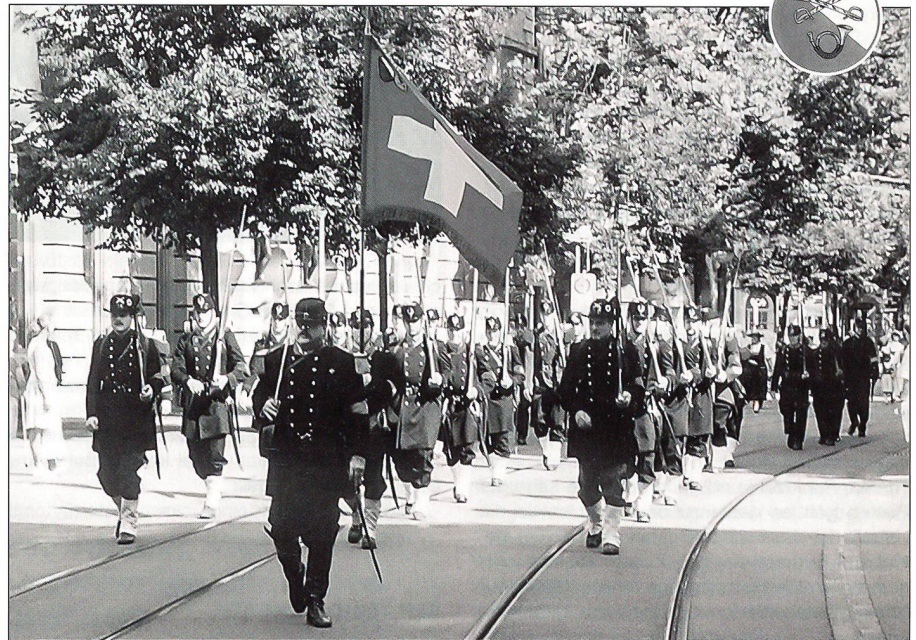
Marschgruppe auf der Zürcher Bahnhofstrasse.

schaft nach den Reglementen des vorletzten Jahrhunderts und der Schützenmeister besorgt die Ausbildung in der «NGST» von anno dazumal.