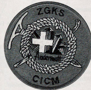
Farben: Auf grünem Grund in Gelb das Gletscherseil und der Eispickel, dazu in der Mitte das Schweizerkreuz und stilisierte Kristalle vor blauem Hintergrund.