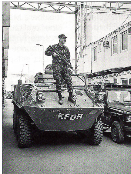
Soeben im Swiss Camp in Suva Reka eingefahren.

Die Bewaffnung, um die es geht, entspricht den Standards, die beispielsweise Österreich in seiner bereits jahrzehntelangen Praxis für friedensunterstützende, nicht friedenserzwingende Operationen definiert und erprobt hat. Die Festlegung der Ausrüstung und Bewaffnung eines Verbandes erfolgt generell auf Grund des Mandats der Operation, die man unterstützen will, und des spezifischen Auftrags, den man anzunehmen gewillt ist. Die konkrete Vorgabe durch die Einsatzregeln («Rules of engagement») bestimmt schliesslich die konkrete Bewaffnung und Ausrüstung des ein-