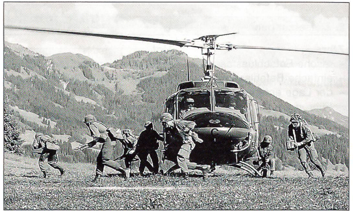
Eine Jägergruppe des österreichischen Bundesheeres beim Luftlanden mit dem Hubschrauber AB-212.

das Bundesheer weiter fähig bleibt, den Schutz der Bevölkerung zu gewährleisten, sind eine gute, einsatzorientierte Ausbildung sowie eine moderne, dem internationalen Standard angepasste Ausrüstung und Bewaffnung unerlässlich. Denn nur so haben die Soldaten unseres Heeres eine echte Chance, die in sie gesetzten Erwartungen zu erfüllen. Auch wenn das eine oder andere noch zu tun ist, so darf Österreich auf sein Heer mit Recht stolz sein, auf ein Heer, das durchaus jede Bedrohung abwenden kann.»