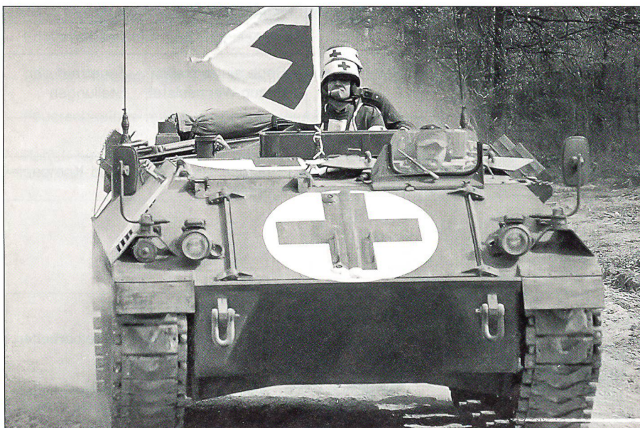
Österreichischer Sanitätspanzer «Saurer».

Mit dem Zusammenbruch des kommunistischen Gesellschaftssystems in Osteuropa und mit dem Zerfall der Sowjetunion ging Ende der Achtzigerjahre die Nachkriegsordnung in Europa zu Ende. Der Fall des Eisernen Vorhangs hatte unter ande-