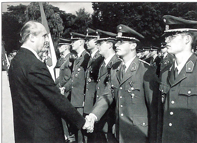
Bundespräsident Dr. Thomas Klestil gratuliert den Militärakademikern zur bestandenen Ausbildung.

rem zur Folge, dass die Reisefreiheit mit immer grösserem Umfang in Anspruch genommen wurde und wird.