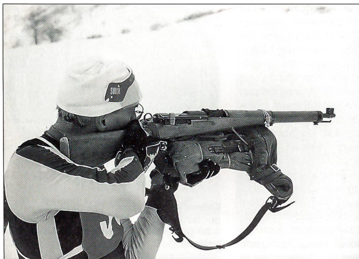
Eine Waffe, die offenbar nie aus der Schweizer Armee verschwindet: der untödliche Karabiner 31.