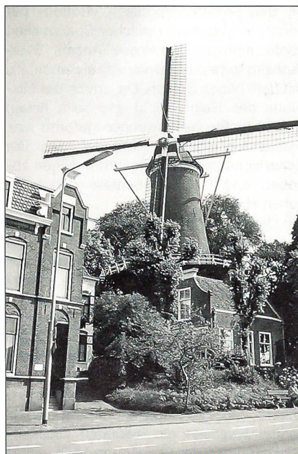
Was wäre Holland ohne Windmühlen?

Während allen vier Marschtagen durften die Wetterbedingungen dann aber als nahezu optimal bezeichnet werden. Die Marschierenden konnten sich weder über Regen noch extreme Hitze beklagen. Auch die musikalischen Unterhaltungen und das begeisterte Publikum am Wegrand trugen zur guten Moral bei. Im Delegationsstab