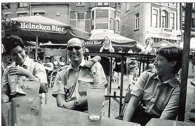
Ausflug in die Stadt Nijmegen am Montag vor dem Marsch.