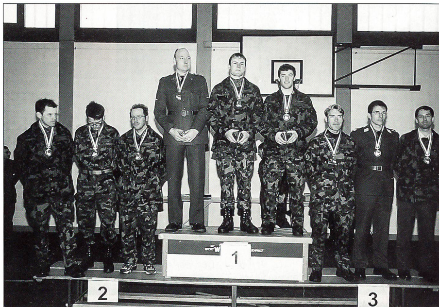
Die erstrangierten Sturmgewehr-Patrouillen des Feldarmee Korps 2 auf dem Siegerpodest.