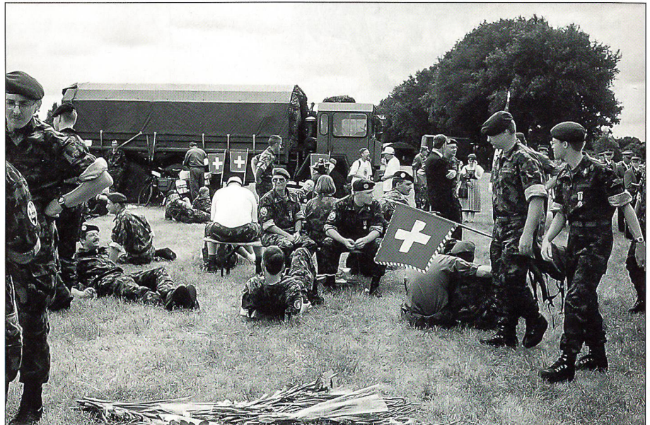
Warten auf dem Retablierungsplatz Charlemagne/Schuttershof auf das Defilee.

Am Samstagmorgen wurde in guter Stimmung die Bahnreise nach Holland angetreten. Am Bahnhof Nijmegen überraschten uns Mitglieder der Marschgruppe SVMLT mit einem Spalier, welche den Weg von der Schweiz nach Holland auf dem Velo zurückgelegt hatten. Am Abend konnte die Unterkunft bezogen werden. Sämtliche Militärpersonen, welche an dieser Veranstaltung teilnehmen (rund 5000), sind im Armee-Camp Heumensoord einquartiert. Dieses Camp ist eine eigens für diesen Anlass angelegte Zeltstadt in einer Waldlichtung. Für die zum Teil verblüffend kühlen Nächte konnte nicht nur ein Armeeschlafsack, sondern wiederum auch ein Faserpelz-Schlafsack gefasst werden. Für das persönliche Wohl werden Duschen, Wasch- und Rasiermöglichkeiten