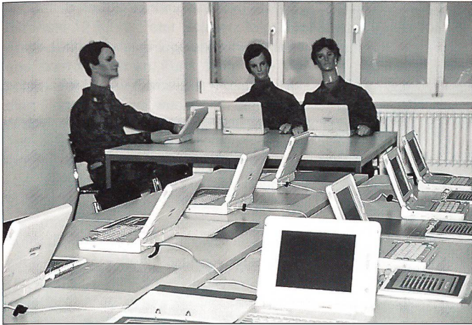
Im renovierten Altbau erinnert nicht mehr viel an die alte Infanteriekaserne. Die moderne Kommunikationstechnik dominiert das Bild.