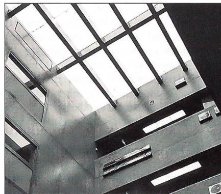
Die moderne Architektur symbolisiert die Transparenz im Neubau des AAL.

«Lapidar, ökonomisch, ein Symbol der selbstverständlichen Notwendigkeit!» Auf dieses Ziel sind laut Kantonsbaumeister Mahlstein Konzept, Form und Organisation des Neubauprojektes ausgerichtet. Als «einfache Kiste» erfüllt der Neubau die hohen Ansprüche an Licht, Übersichtlichkeit und Erschliessung. Das «innere System» dient gleichzeitig der Erschliessung, dem Bezug zur Landschaft und der Definition von Funktionsbereichen. Die Fassade aus Glas- und Bronzeelementen und die innere