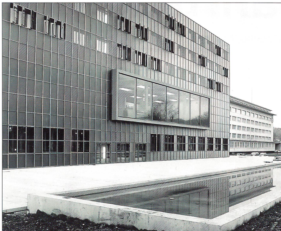
Das Armee-Ausbildungszentrum Luzern umfasst zwei Bauten, die eine gelungene Einheit bilden, nämlich den kürzlich eingeweihten Neubau links, und den aus den Dreissigerjahren stammenden und umfassend renovierten Altbau rechts im Bilde.