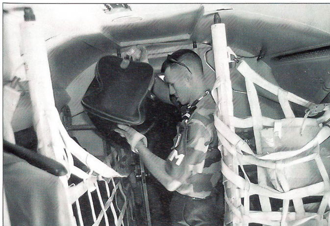
Ein französischer Soldat verlädt Gepäck für den Retourflug in die Schweiz.

langsam vorwärts, wir haben starken Gegenwind. Das Ground Speed des Global Positioning Systems (GPS) bleibt beharrlich auf 198 Knoten stehen. Der Anflug nach Bern führt vom Funkfeuer Willisau dem Limpachtal entlang ins Seeland. In Bern verlassen die Passagiere das Flugzeug. Für die Crew bleibt noch der 20-minütige Rückflug über Willisau und Hochwald nach Basel. Kurz vor sechs Uhr abends ist die Fokker wieder auf ihrem Heimatflughafen. Gute zwölf Stunden dauerte die Rotation, davon über sieben Stunden in der Luft. Noch folgt die Erledigung der Administration, doch dann ist Feierabend. Die Crew ist nun entspannt. Die Fliegerkombis mit den OSZE-Abzeichen werden ausgezogen und man genehmigt sich noch einen kurzen Drink in einem Basler Restaurant. Wieder das Gefühl eines Wechselbades: Nach einem ganzen Tag im Flugzeug wieder fester Boden unter den Füssen und «zurück unter den Leuten». ❏