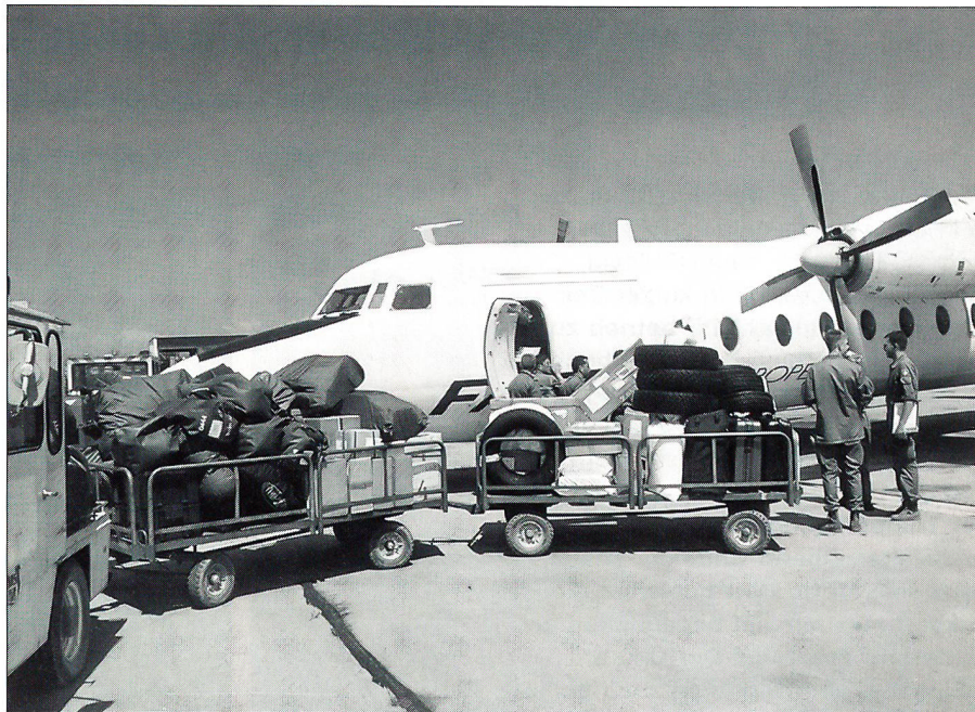
Die Fracht ist in Sarajevo ausgeladen.

Gutgelaunte französische Soldaten laden die Fracht ein und aus. Von Hand zu Hand reichen sie die zum Teil schweren Pakete und Gepäckstücke. Nichts ist davon zu spüren, dass sie unmotiviert wären, weit weg von ihrer Heimat in einem kriegsversehrten Land Dienst leisten zu müssen. Neue Passagiere steigen ein: Es sind hohe ausländische Militärpersonen, die zu einer Weiterbildung in die Schweiz kommen. Schon bald beginnen die Rolls Royce Dart-Triebwerke der Friendship wieder zu drehen. Dem Rollweg entlang bietet sich in einer grossen Reihenhaussiedlung wieder ein Bild der Zerstörung. Neben dem Rollweg liegt ein Flugzeugwrack, ausgeschlachtet und vergessen. Vor uns startet ein Learjet der US Air Force Europe. Es ist das gleiche Flugzeug, das uns im Anflug auf Sarajevo gefolgt ist. Kurz vor Mittag erfolgt der Start auf Piste 30. Nun wird es über dem Balkan doch etwas gewitterhaft. Wir fliegen neben hohen Wolkentürmen. Die Flugsicherung meldet einen Traffic, der uns beim Waypoint Bosna entgegenfliegt. Gespannt schauen Le-