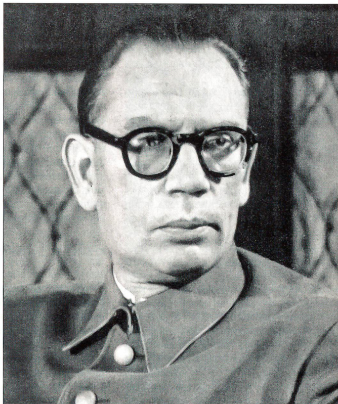
Andrej Andrejewitsch Wlassow

gen Verhältnissen gekommen. Die Mehrheit der Bevölkerung hoffte auf einen Sturz Stalins. Plünderer trieben sich herum. Da erhielt Wlassow den Befehl, sich um Mitternacht bei Stalin zu melden. Der Diktator übertrug ihm den Oberbefehl über eine neu zu bildende 20. Armee, um mit ihr den Vorstoss der Deutschen zu stoppen und Moskau zu retten. Wlassow hatte Erfolg und wurde, mit höchsten Auszeichnungen verbunden, zum Generalleutnant befördert.