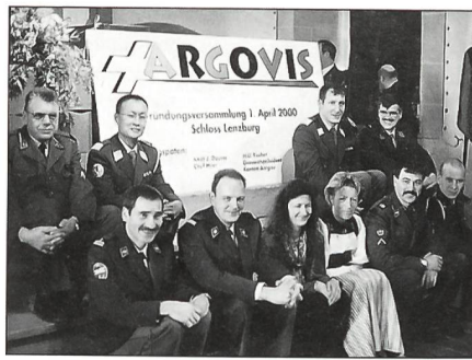
Der neue Vorstand vor der Gründungsurkunde, welche anschliessend durch alle Anwesenden unterzeichnet wurde.

Mit der Auflösung des Kantonalverbandes AUOV ging die Geschichte der Aargauer Unteroffiziere in keiner Art und Weise unter. Vielmehr soll der neue Verein mit seinem grossen Einzugsgebiet wieder Elan in die ausserdienstliche Tätigkeit der Unteroffiziere im Aargau bringen. Es hat von der