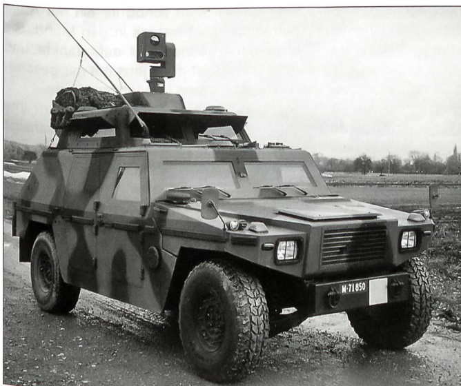
Leicht gepanzertes Fahrzeug für die Schiesskommandanten der Panzertruppen. Auf dem Dach das Navigations- und Vermessungsgerät.