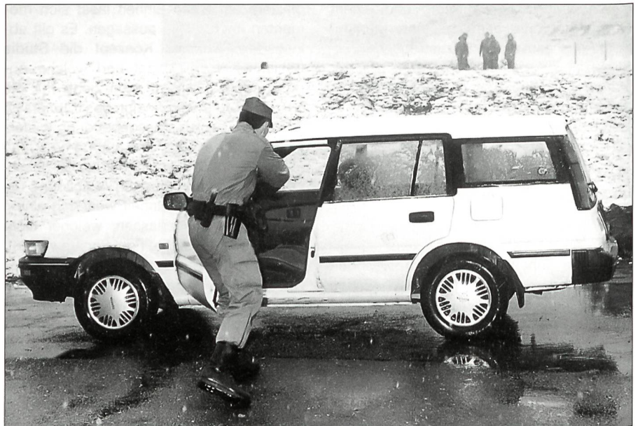
Festungswächter beim Anhalten bzw. Durchsuchen einer verdächtigen Person.

ker usw. liquidierte, bekam das Festungswachtkorps eine neue Aufgabe. Neben dem Überwachungsgeschwader ist das FWK der einzige militärische Zweig der Armee, der aus Berufsmilitär besteht. Hauptaufgabe ist die Sicherheit, genau definiert als Sicherungselement der ersten Stunde. Wenn es um heikle Bewachungsaufgaben geht, wie zum Beispiel eine Botschaftsbewachung oder Sicherung von Schweizer Einheiten im Ausland, dann ist dies jetzt und in Zukunft Aufgabe des FWK. Neues Personal wird ausschliesslich nur noch für den Sicherheitsdienst rekrutiert, beim technischen Unterhalt wird eher abgebaut, bzw. der Personalbestand auf einem sta-