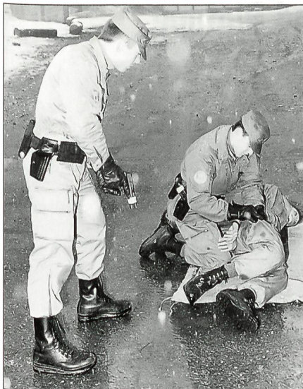
Zwei Festungswächter üben das Durchsuchen eines Verdächtigen. Währenddem ein Soldat die Person durchsucht, sichert ihn sein Kamerad ab.

Swisscoy ist ebenfalls ein Detachement im Kosovo im Einsatz.