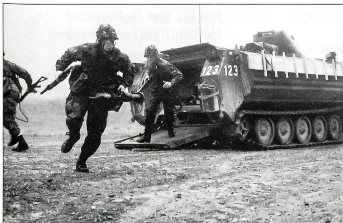
Panzergrenadiere im Gefechtseinsatz.

ten Truppen (Panzer, Panzergrenadiere, Aufklärer) sind während der Grundausbildungsperiode der ersten zehn Wochen auf dem Waffenplatz und basieren mehrheitlich auf den Ausbildungsanlagen für Panzer im Polygon und auf der Allmend. Anschliessend verschieben sie sich in die Verlegung, um einerseits die Scharfschiessen, andererseits die Gefechtsübungen zu absolvieren.