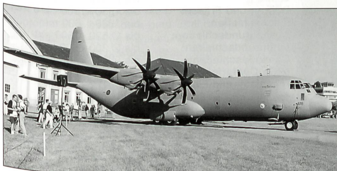
Die moderne Transportmaschine Hercules C-130 J der Royal Air Force.

Segelflug, Modellflug, Fallschirmspringen, Hängegleiten usw. rundeten die fliegerischen Darbietungen ab.