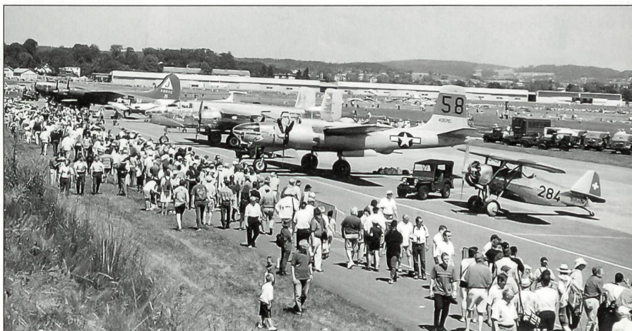
Die gepflegten Oldtimer-Flugzeuge wurden von den zahlreichen Festivalbesuchern bestaunt.

Einmalig war ebenfalls die Präsenz der verschiedenen zivilen Propellerflugzeug, wie die russische viermotorige IL-18 der ru-