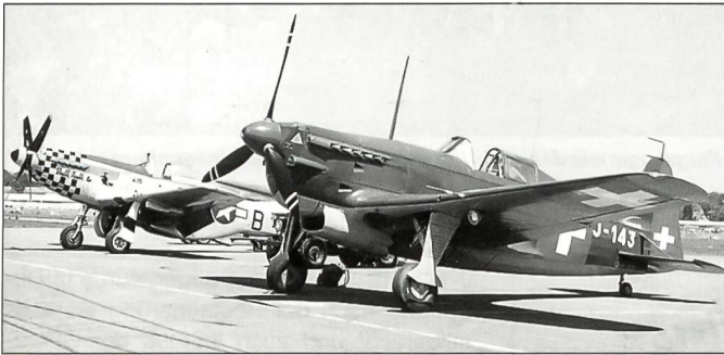
Zwei Jäger, die früher bei der Schweizer Luftwaffe im Einsatz standen. Vorne die Morane D-3801 und hinten eine Mustang P-51.

Das Flugfestival Dübendorf 2000 war insgesamt eine sehr schöne, interessante und erfolgreiche Airshow, es ist jedoch zu hoffen, dass bei einem nächsten Meeting in Dübendorf auch wieder Jets vorgefliegen werden können, denn auch diese gehören zu einem Flugmeeting dieser Grösse. ☒