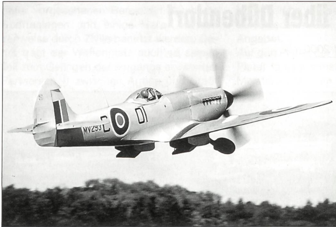
Start der Spitfire zur Vorführung in Dübendorf.