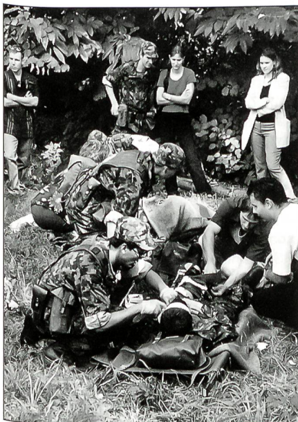
Ein Verletzter wird fachgerecht versorgt. Die Besucher des RS-Besuchstages auf dem Ceneri werden gleich integriert.