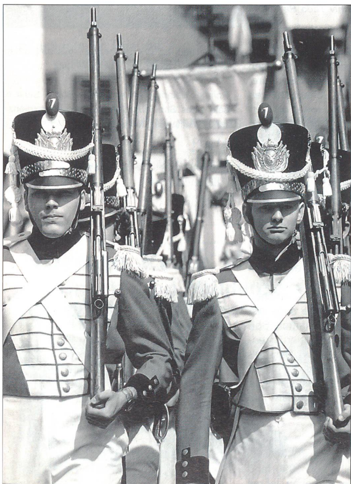
Füsiliere der Cumpagnia da mats (königlich-französisches 1. Schweizer Garderegiment Nr. 7 um 1825). Ein Zugeständnis an die Neuzeit bilden lediglich die Gewehre 1911.

sche Aufnahmen zeigen, ergab dies zuweilen einen recht skurrilen französisch-neapolitanisch-britisch-päpstlichen Mischmasch, ergänzt durch Effekten kantonaler und eidgenössischer Ordonnanz. Spätere Neuanschaffungen sahen dem Sommertee der Füsiliere des französischen 1. Schweizer Garderegiments Nr. 7 ähnlich. Gesamthaft betrachtet blieb die Uniformierung aber ein Flickwerk.