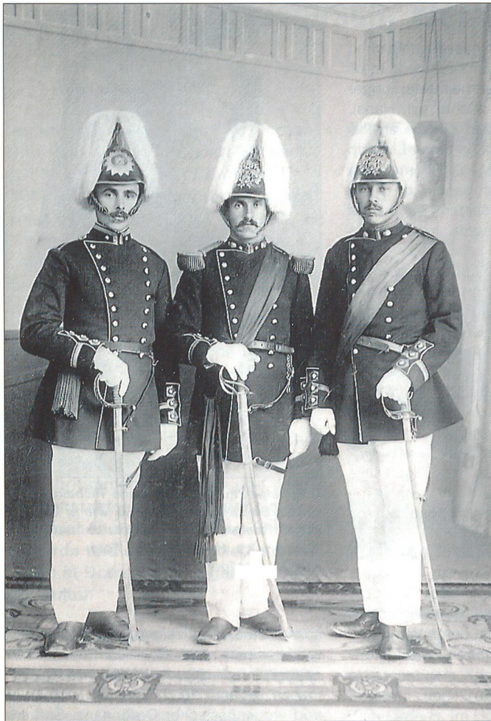
Offiziere der Cumpagnia da mats um 1915 – ein päpstlich-britisch-eidgenössischer Uniformen-Mischmasch.

gemeinde, der Politischen Gemeinde und der Katholischen Kirchgemeinde sowie Beiträge von Vereinen, Stiftungen und Firmen hatten diese Grossinvestition ermöglicht.