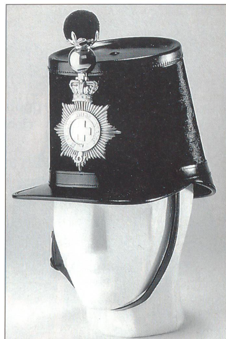
Originalgetreue Replika eines Tschakos der British Swiss Legion 1854/56, wie er von den Offizieren der Cumpagnia da mats zu tragen wäre. Hersteller und Foto: KRESA, Detligen.

Jahrzehntelang trug die Cumpagnia da mats Uniformen, die einst durch Veteranen in die Heimat gelangt waren. Wie histori-