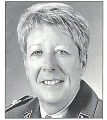
Brigadier Doris Portmann

Ausgangspunkt ist die völlig neu konzipierte Aushebung. Geplant ist, dass sie für alle Armeeingehörigen ein bis drei Tage dauern wird. Klare Anforderungsprofile für jede in der Armee vorhandene Funktion werden die Grundlage für die Examinierung sämtlicher Absolventinnen und Absolventen der Aushebung bilden. Die Eig-