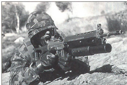
Grenadier mit dem Gewehraufsatz in der Annäherung an ein Gebäude. Er setzt die Waffe im Direktschuss auf eine Fensteröffnung ein und sichert so das weitere Vorgehen der Gruppe.

Infanterie oder der Genietruppen (Sappeure) eine Grundausbildung von einem Monat absolviert hatten und, dank ihrer hervorragenden Leistungen, nach Locarno zur Grenadierausbildung versetzt wurden. Für die Ausbildung zeichnete die damalige Abteilung für Genie verantwortlich. Erst 1946 übernahm die Abteilung für Infanterie die Grenadierschulen.