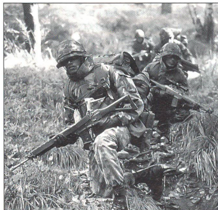
Grenadiere unterwegs im Wald, im Einsatz hinter den feindlichen Linien. Ein durchwegs vorstellbares Szenario für Eliteinfanteristen.

Leistung ist aber von jeher des Grenadiers Alltag, wobei durchwegs höchste Anforderungen gestellt werden. Wer nicht selbst von Natur aus dafür motiviert ist, mehr zu leisten als der Durchschnitt, der wird bald einmal überfordert sein. Die innere Einstellung muss dabei mitmachen, Leistungsfreude ist ein Muss; diese ist aber dank der Freiwilligkeit der Leute bereits einkalkuliert. Die Bereitschaft zu Überdurchschnittlichem ist in diesem Sinne eine klare Forderung seitens der jeweiligen Schulkommandanten. Die Schule hat Aus-