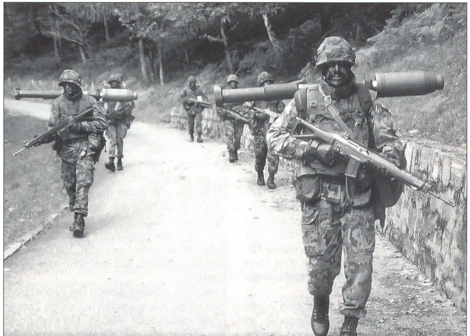
Der Einsatzort muss unter Umständen nach wie vor zu Fuss erreicht werden. Dies kann insbesondere bei Einsätzen hinter den feindlichen Linien der Fall sein. Grenadiere müssen deshalb nach wie vor auch marschieren können.

Die Grenadiere geniessen auch heute unter Kennern wie auch in der Bevölkerung ein unverändert hohes Ansehen. Ihr Image ist allgemein sehr gut, und wer das Erkennungszeichen des Grenadiers am Waffenrock tragen darf, ist berechtigterweise stolz darauf. Die Grenadiere werden denn auch vielfach bewundert, sind doch die von ihnen zu erbringenden Leistungen bekannt. Dieses Image kommt aber nicht von ungefähr: Es ist in langen Jahren entstanden und muss von jedem Einzelnen erarbeitet und bestätigt werden. Die Grenadiere zeichnen sich nach wie vor durch sicheres Können, Reaktionsfähigkeit, Gewandtheit, Mut und Zähigkeit, getragen von frischem und frohem kameradschaftlichem Geist aus. Und dieser Geist muss sich nicht nur im Dienstbetrieb, sondern selbstverständlich auch im Ausgang und im Urlaub zeigen: Grenadiere sollen dadurch auffallen, dass sie sich hervorragend benehmen und in jeder Lage korrekte Haltung zeigen. Die wiederum führt zurück zu ihrer Arbeit. Auch im Einsatz verlangt man