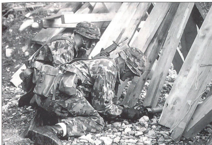
Ein Grenadiertrupp bereitet mit einem Sprengrohr die Sprengung eines Brückenkopfes vor.

schulen auch: Drill und nochmals Drill. Doch erhält man den Eindruck, dass bei den Grenadiern alles noch einmal so gut, noch einmal so schnell gehen muss. In den ersten Wochen wird die Grundausbildung vermittelt, welche sich von derjenigen anderer Schulen kaum unterscheidet, dann erst folgt die eigentliche Ausbildung zum Grenadier. Trotz des grossen Druckes, welcher auf den Schülern lastet, herrscht überall eine gute Atmosphäre. «Mir stinks» hört man hier nicht, und der Wunsch, Leistung zu erbringen, steht den Rekruten direkt ins Gesicht geschrieben. Diesen Leistungswillen nützen die Verantwortlichen dann geschickt aus, indem sie ihn auf das Ziel der Kriegstüchtigkeit lenken, alles andere geht wie von selbst. Verlangt werden aber von jedem Schüler vollste Hingabe und Initiative. Der Grenadier muss das Beste geben, und dies aus eigener Überzeugung. Im Idealfalle müssten die Rekruten selbst an ihre Aufgabe glauben und einen Auftrag nicht nur des erhaltenen Befehls wegen erfüllen. Die Kader sind sich denn auch darüber einig, dass mit den Grenadierrekruten beinahe jede Aufgabe lösbar ist.