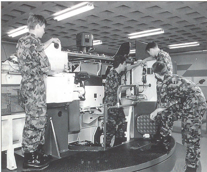
Die Fahr-, Ziel- und Schiessfertigkeit wird immer mehr mit Simulatoren geübt.

das militärisch Gelernte auf ihre zivile Tätigkeit zu transferieren. Nur zivil verwertbare Führungsfähigkeiten werden bewusst nicht geschult; das können zivile Anbieter besser und zielgruppengerechter. Die Zertifizierung der Führungsausbildung ist eines der Postulate der «Konzeptionsstudie Ausbildung XXI». Sie bringt den involvierten Kadern, Wirtschaftsunternehmen und Bildungsinstituten, aber auch der Armee namhafte Vorteile und wird nach den offiziellen Verfahren durchgeführt. Die Arbeiten dazu sind im Gang, doch ist die Realisierung nicht ohne Partnerschaft von Wirtschaft und Bildungsinstituten möglich. Nur mit ihrer verbindlichen Anerkennung solcher Zertifikate gewinnen sie zivilen Wert.