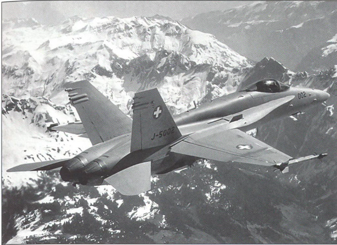
Unsere Luftwaffe übernimmt im Falle einer militärischen Bedrohung die Raum-sicherung.