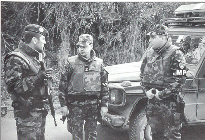
Jeder Soldat muss zu seinem Selbstschutz und zum Schutz seiner Kameraden – besonders bei Auslands-einsätzen – bewaffnet sein.

Das Schiff hat noch einige Wellen zu brechen und einige Stürme zu durchqueren. ☑