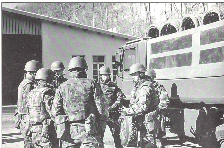
Befehlsausgabe an die Gruppe

Ich verlange, dass Sie die knappe Ausbildungszeit nutzen, praktisch arbeiten und