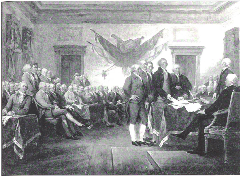
Unterzeichnung der amerikanischen Unabhängigkeitserklärung. Gemälde von John Trumbull (1756 – 1843). Thomas Jefferson überreicht im Namen des mit der Ausarbeitung beauftragten Ausschusses den Entwurf der Unabhängigkeitserklärung. Rechts neben ihm Benjamin Franklin.

geschaffenen USA sind ihrem ersten Präsidenten so wenig vertraut wie einst das Heer, dessen Oberkommandierender er geworden war. Er brachte wenig politische Erfahrung mit ins Amt. Erstmals sollten die neuen Theorien der Gewaltenteilung verwirklicht werden.