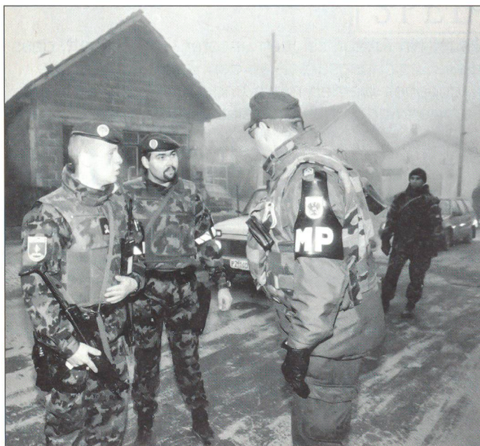
Angehörige der Schweizer Armee leisten seit 1999 im kriegszerstörten Kosovo Wiederaufbauarbeit. Bild: zwei Schweizer und ein österreichischer Militärpolizist.

Ich bin militärischer Chef und gelernter Jurist. Als militärischer Chef sage ich: Die Waffe gehört zur persönlichen Ausrüstung jedes Soldaten, in jeder Armee. Als Jurist sage ich: Die Waffe ist nötig für den legitimen Selbstschutz. Doch die höchste Verantwortung eines Chefs – noch vor jedem