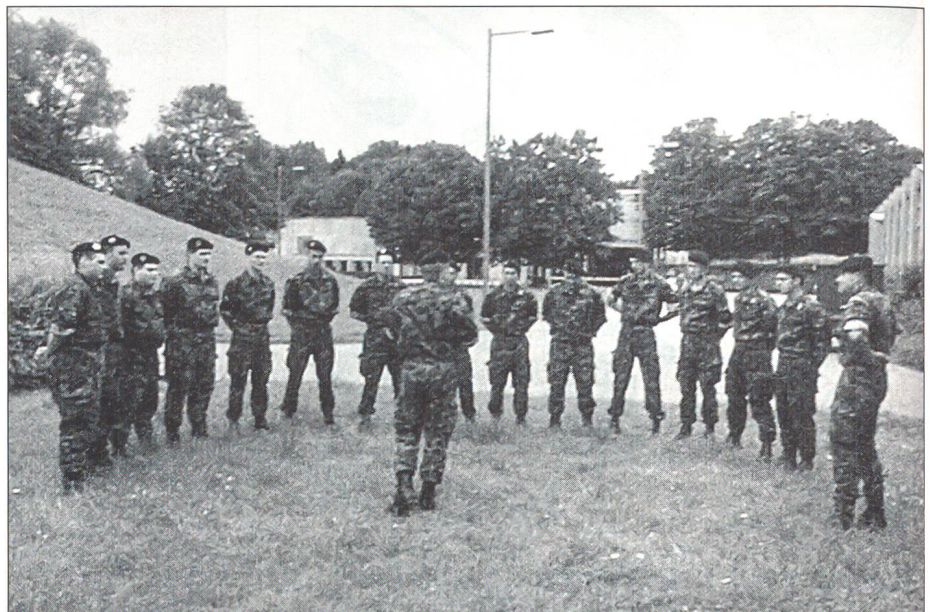
Erster Kontakt mit den Instruktoren Klasse 1.

Von den etwa 90 gemeldeten Unteroffizierschülern rückten, bedingt durch vordienstliche Dispensationen, lediglich 45 Männer und 1 Frau ein, wovon einer am