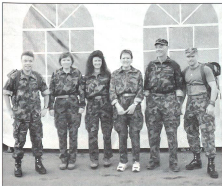
Das Argovis-Team am Berner 2-Tage-Marsch vor dem Start ...

Mit der Bildung eines rund 15-köpfigen Vorstandes wurden die Aufgaben vielfach verteilt. Dies hat sich für das einzelne Mitglied deutlich bemerkbar gemacht. Wenn jedes Vorstandsmitglied 3x pro Jahr einen Beitrag an das Programm leistet, so können den Vereinsmitgliedern über 40 Angebote unterschiedlichster Art unterbreitet