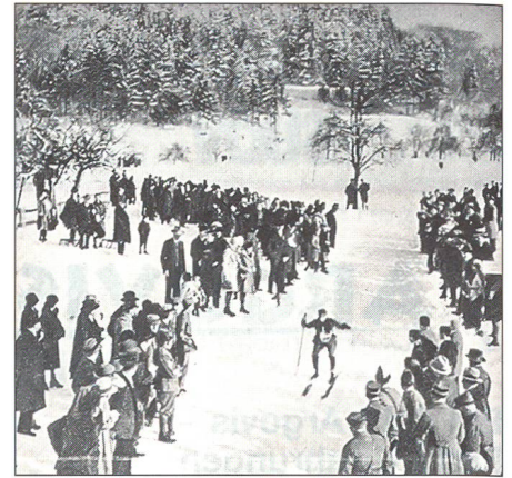
Skijörning, Abfahrtsrennen vom Jakobsberg auf 1300 Meter und 15 Kilometer langer Patrouillenlauf, das am 1. Militär-Skitag anno 1931 in Bäretswil/Bettswil stattfand.

Am 31. Januar 1931, dem ersten Militärskitag des Unteroffiziersverbandes Zürich und Schaffhausen – organisiert vom Unteroffiziersverein Zürcher Oberland (UOVZO) – wurde das damals noch schneesichere Gelände rund um das da-