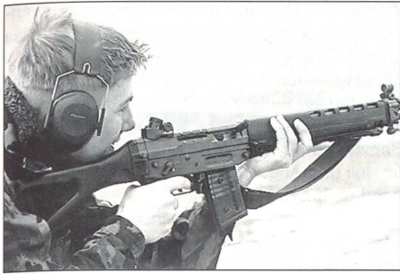
Es gibt noch Junioren, welche den Bachtel-Winterwettkampf bestreiten.