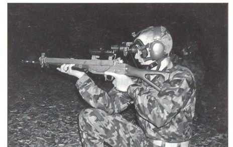
Technische Hilfsmittel (hier die Nachtsichtgeräte und Laserpointer) können im UOV Argovis praktisch angewandt werden.

Fazit: Skriptum ist ein Vereinsorgan mit professionellem Auftritt. Dadurch kann es auch an Dritte abgegeben werden, welche ohne Vereinszugehörigkeit viel Neues erfahren können. Allerdings ist durch die «Entregionalisierung» die Verpflichtung von Inserenten bedeutend schwieriger geworden. Oft haben in den «Vereinsheftli»