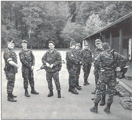
Für die Übungen im Gelände wird in der Regel im TAZ angetreten.

die lokalen Gewerbler ein Inserat geschaltet, welches sie in der überregionalen Auflage nun nicht mehr erscheinen lassen. Damit wird die Einnahmequelle «Inserate» trotz viel grösserer Auflage bedeutend schwieriger anzupapen sein als früher. Die geplante Einführung von Stelleninseraten mit dem Zielpublikum «Absolventen der UOS» hat noch keine Früchte getragen.