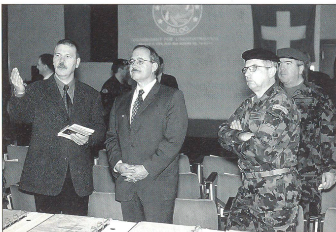
Der Chef VBS lässt sich gerne klar und umfassend informieren.

In der Schweiz können nicht mehr alle Übungen durchgeführt werden, die es braucht, um den nötigen Ausbildungsstand für den Verteidigungsauftrag zu erreichen und zu halten. Solche Übungen sind aber für das Milizkader als grosser Anreiz sowie als Erfahrungstransfer von wesentlicher Bedeutung. In der Luftwaffe und bei den Mechanisierten Verbänden können