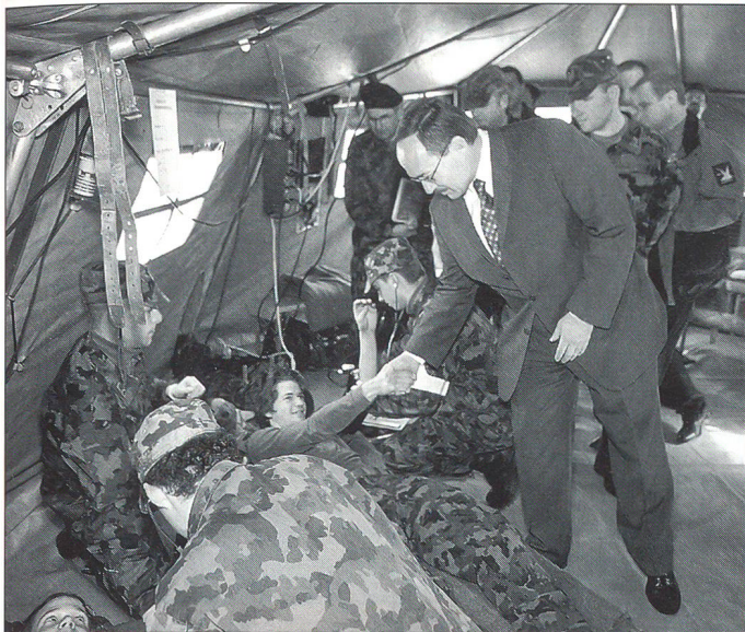
Der Chef VBS liebt die Truppennähe.

heute zudem wichtige Ausbildungselemente nicht mehr geübt werden. Ich denke dabei an hinlänglich bekannte Faktoren, welche uns einschränken: Nachtflug-, Tiefflug- oder Überschallflugverbote respektive -einschränkungen, um nur einige zu nennen. Die Ausbildungsvorlage würde die Verfahrensabläufe mit dem Ausland vereinfachen und bringt beiden Seiten nur Vorteile. Es geht überhaupt nicht darum, dass ausländische Truppen in der Schweiz stationiert werden würden. Wenn wir ja keinen Platz haben, gewisse Ausbildungen in der Schweiz zu machen, hätten es unsere Ausbildungspartner bei uns ja auch nicht. Wir können vielmehr unsere modernen Simulatoren zur Verfügung stellen, diese somit besser ausnutzen und im Kontakt mit den ausländischen Armeen unsere Ausbildung verbessern. Ich fühle mich als Vorsteher des VBS für die Ausbildung und für ein Kriegsgenügen der Armee verantwortlich.