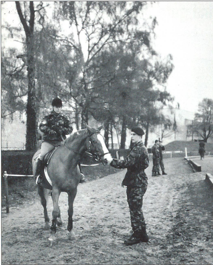
Nach dem Einreiten konzentriert sich die Wettkämpferin auf den Start.

Dies nachdem noch im Monat Februar aus dem Bundeshaus die klare Botschaft verbreitet wurde, der Train hätte in der neuen Armee keinen Platz mehr! Dies war mehrmals für alle Menschen in unserem Land, die einen Bezug zum Armeepferd als zuverlässigem Helfer in Krisensituationen haben, ein herber Schlag.