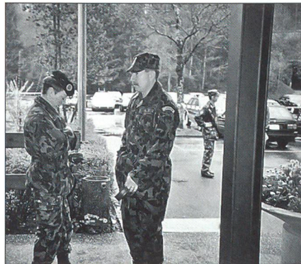
«Fachsimpeln» vor dem Einsatz.