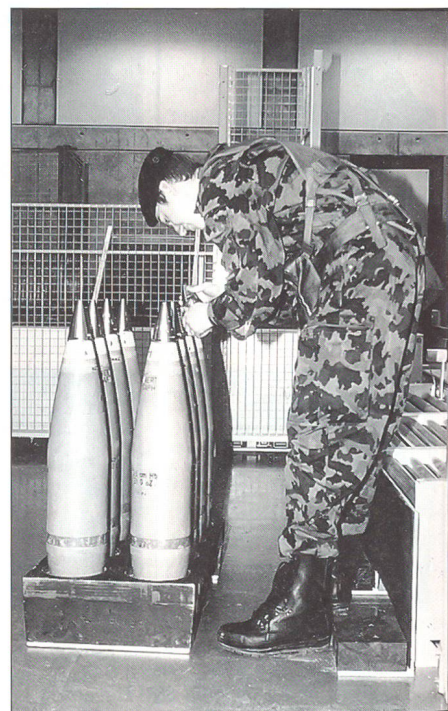
Im Schiesssimulator beim Temperieren der Art Granaten.