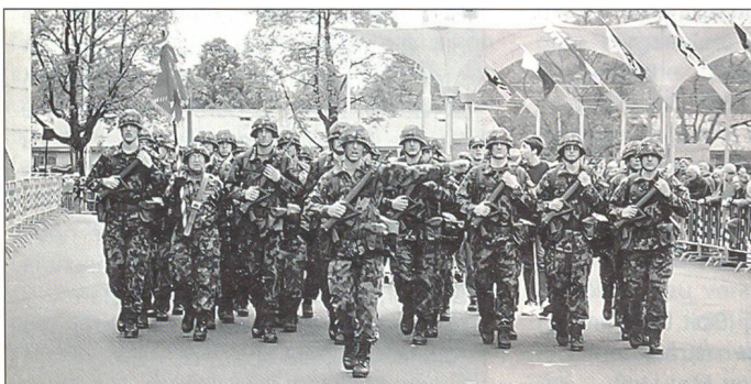
Aspiranten einer Offiziersschule benützten den 2-Tage-Marsch als Vorbereitung für den 100-km-Marsch.