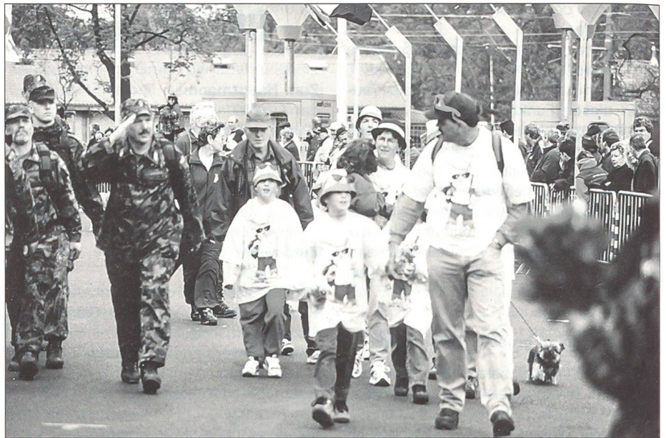
Alles marschiert mit: Uniformierte und Zivilisten.

Dem OK des Zwei-Tage-Marsches ist es dank verschiedenen Massnahmen gelungen, die Schulden der Vorjahre restlos abzubauen, ohne dass die Startgelder angehoben werden mussten. Um besonders Familien die Anmeldung schmackhafter zu machen, sind hier die Preise sogar gesenkt worden. Für die Zukunft werden die Teilnehmerzahlen entscheidend sein, da neue Sponsoren kaum gefunden werden kön-