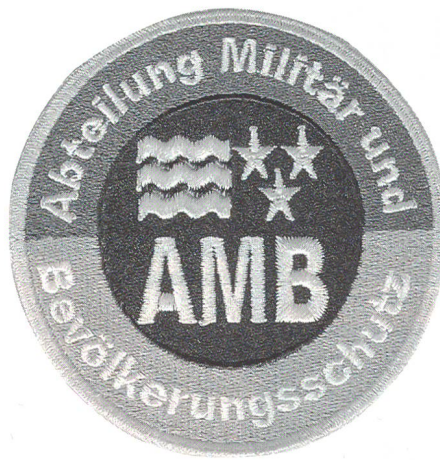
Eine gute Idee: ein eigener Badge

Schweiz (Lothar, Hochwasser, Berg- und Hangrutsche usw.) haben auch im Berichtsjahr die Wichtigkeit der entsprechenden Vorbereitungsmaßnahmen aufgezeigt.