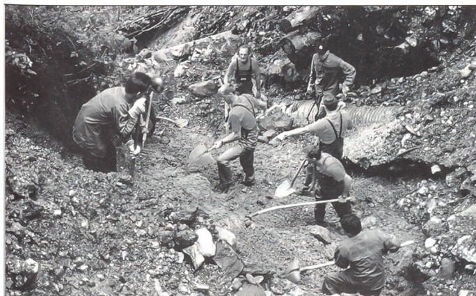
Zivilschutz im Einsatzgebiet

Mit der Neugliederung und der neuen Aufgabenverteilung hat der Kanton den bevorstehenden Reformen von Armee, Zivilschutz und Bevölkerungsschutz weitgehend und vor allem rechtzeitig Rechnung getragen.