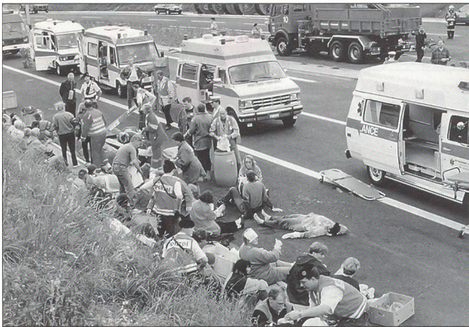
Verbundsystem Be- schutz

Tauglichkeitsgrad lag mit 86,7 Prozent wiederum über dem Landesschnitt von 84,0 Prozent.