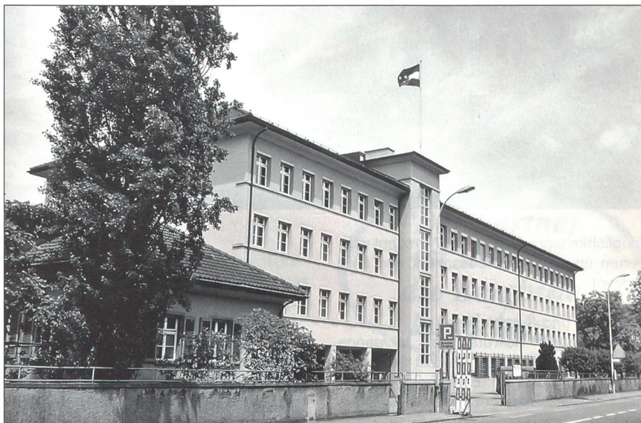
Standort AMB Zeughaus Aarau

Im Hinblick auf die Reformen Armee XXI und Bevölkerungsschutz war der Kanton Aargau auch im Berichtsjahr in verschiedenen Arbeitsgruppen des Bundes und der Kantone vertreten. Beide Reformen sind nicht nur Sache des Bundes, sondern auch der Kantone, und diese werden in die Mitverantwortung der künftigen Ausgestaltung der Armee und des Bevölkerungsschutzes miteinbezogen. Der ganze Reformprozess ist so angelegt, dass ab dem Jahre 2003 mit Teilen der Umsetzung begonnen werden kann.