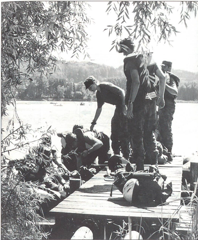
Felddienstübung 2001: Verlad in die Boote M6 beim Burgäschisee

umwunden und selbstbewusst die Leistung gelobt und erst noch die eigene. Diese Leistungsfreude und dieses Selbstbewusstsein dürften, ja sollten sich mehr Schweizerinnen und Schweizer zu Herzen nehmen, als dies landläufig der Fall ist. Sie, liebe Unteroffiziere haben bereits viel geleistet. Sie dürfen heute: