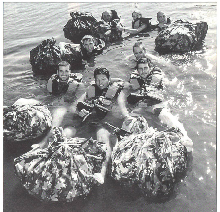
Felddienstübung 2001: eine Patrouille im Inkwilensee.