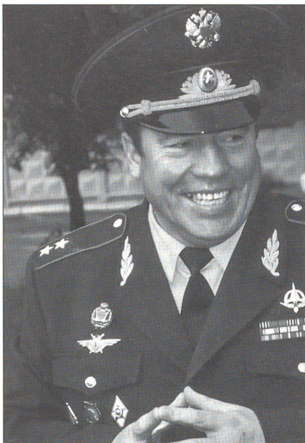
Generalleutnant Naidjanow, stellvertretender Kommandant der Luftwaffen-Akademie.

politischen Führung der Gorbatschow- und Jelzin-Jahre.