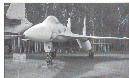
Eine Suchoi-27 in der Gagarin-Akademie.

Als Krisensymptome nannte Fedorow: die schlechte Moral und Disziplin der Truppe,