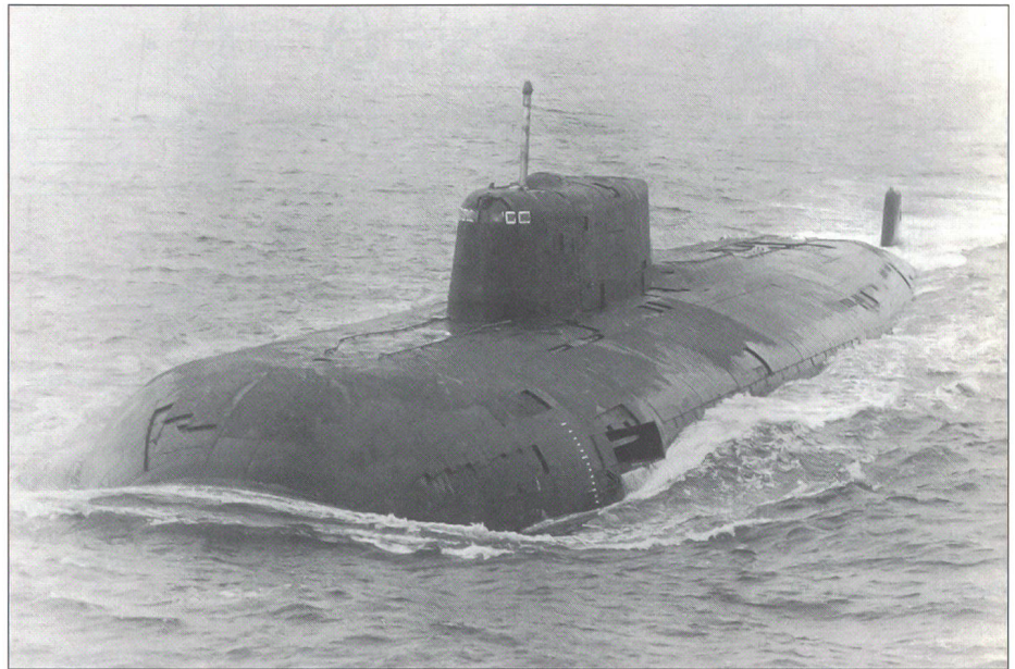
Eine Luftaufnahme der «Kursk», aufgenommen von einem P-3B-Langstreckenaufklärer «Orion» der Königlich-Norwegischen Luftwaffe. Die gewaltigen Ausmasse des Bootes sind auf den doppelten Rumpf (eine äussere und innere, die so genannte Druckhülle) zurückzuführen, die die Boote weniger verwundbar machen.

Die stattliche Zahl von über 120 U-Booten ist mit der derzeitigen desolaten Wirtschaftslage Russlands eigentlich kaum vereinbar. Trotzdem beharrt die militärische Führung noch auf diesem ambitiösen Bestand. Dies, obschon die Mittel nicht mehr zu einer vernünftigen Ausbildung und Betrieb ausreichen. Bereits liegen zahlreiche U-Boote ungewartet in den Häfen der Nord- und Pazifikflotte (Severomorsk, Murmansk, Archangelsk und Wladiwostok), die verrostenden und unsachgemäss oder überhaupt nicht entsorgten Nuklearreaktoren geben dabei zu grosser Besorgnis Anlass. 2 Fachleute meinen zwar, dass von den automatisch abgeschalteten Reaktoren der «Kursk» keine unmittelbaren Gefahren ausgehen. Vor kurzem hat nun der russische Präsident Putin den Streitkräften weitere massive Abbaumassnahmen in Aussicht gestellt. Dazu dürfte vermutlich auch die im Dezember 2000 bekannt-