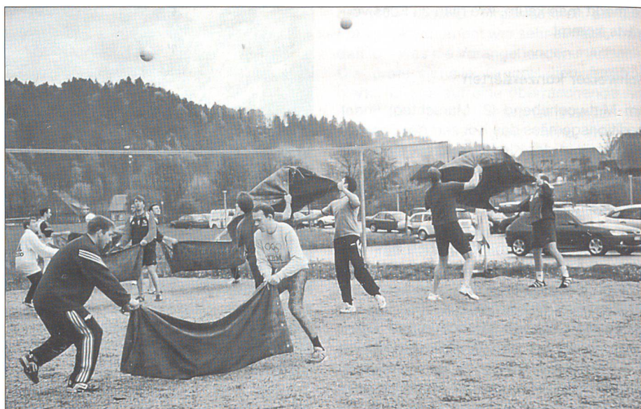
Klasse A. Käser, Variante Ausbildung Beachvolleyball

Was ist ein Sportchef, ein Sportleiter? Neben einem Sportchef sind mindestens zwei Sportleiter die Fachspezialisten für alle sportlichen Aktivitäten in einer Einheit und damit die rechte Hand des Kommandanten. Zusätzlich zur Fachausbildung im WK sollen auch die sportlichen Aktivitäten nicht zu kurz kommen. Diese helfen letztlich, die Kondition und die Konzentration der AdA zu fördern und dienen nicht zuletzt der Kameradschaft. Damit Sportchef