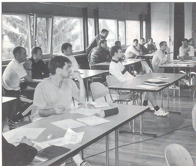
Theorie im Klassen- zimmer «Vorbereitung einer Lektion»

Auf den korrekten Aufbau einer Sportlek- tion wird grosses Gewicht gelegt. Zuerst die Theorie durch die Profis, dann das per- sönliche Miterleben bzw. Nachempfinden der Belastung und der Diskussion des Er- lebten unterstreichen diese Praxisphase. In einem besonderen Workshop konnten neue Sportarten praktisch mitverfolgt wer- den. Die Aerobic-Lehrerin hatte auf jeden Fall die Lacher letztlich auf ihrer Seite. Die Teilnehmer in ihrer Vorführung waren der irrigen Ansicht, einen Plauschabend bei ei- ner holden Dame zu erleben. Weit gefehlt, gefordert und ausser Atem applaudierten sie schliesslich und hatten damit ein mög- liches Beispiel für den nächsten WK mit- bekommen!