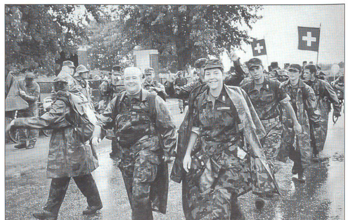
3. Marschtag: Ankunft auf dem kanadischen Friedhof (man war sich punkto Regenmantel wirklich nicht einig!)

Es ist ein unglaubliches Erlebnis, mit so vielen Menschen unterwegs zu sein, die alle das selbe Ziel anstreben. Die Dörfer und Städte sind beflaggt. Wer keine dorf-