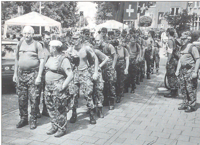
2. Marschtag: Aufstellen für das letzte Teilstück: Habe ich wirklich alle?

ganz besonders als Gruppenführende mit den Vorbereitungen und der Marschteilnahme beschäftigt.