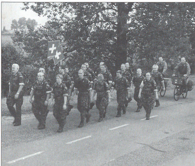
1. Marschtag: gesamte Marschgruppe Interlaken inkl. die beiden Betreuer auf Velo.

Wenn man sich entschliesst, am 4-Daagse teilzunehmen, beginnt das «Abenteuer» eigentlich schon Ende Winter vorher. Gilt es doch, sich selber und eine ganze Gruppe darauf vorzubereiten. Für die Gruppenleitenden bedeutet dies viel Arbeit. Nicht nur die Trainings müssen organisiert werden, auch die Reise und vor allem die Unterstützung und Betreuung der Teilnehmenden. Im Verlaufe des Frühlings stossen laufend neue Personen zur Gruppe und wiederum andere stellen fest, dass es dieses Jahr doch nicht reicht. Es ist oft bis zuletzt fast ein Pokerspiel, wie viele Personen die Gruppe wirklich umfassen wird. Einige Zeit in der Vorbereitungsphase muss oft für die Suche nach einem geeigneten Betreuer verwendet werden. Wir hatten Glück und fanden schliesslich auch zwei Personen, welche sich bereit erklärten, die Gruppe an den 4 Tage, auf dem Velo zu begleiten. In Holland ist man sowohl als Marschteilnehmende als auch